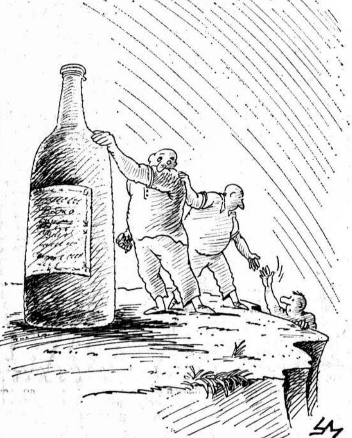
Рисунок Александра Умарова.

П РОСНУВШИСЬ вдруг среди ночи и толая в туалет (и вспоминая, как мочился в постель в восьмилетнем возрасте), я начинаю прикидывать — в каких мы с ним, с сюжетом, нынче отношениях? Вчера ведь в очереди как-то в отдельные мои мысли были, как-то, вползая и могили ему потрафить. (Он тут же их прихватил. Он их заглаживает.) Конечно, всплывший одним боком, он уже