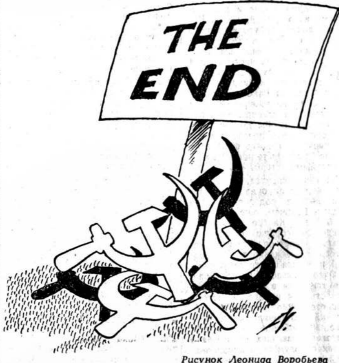
Рисунок Леонида Воробьева

ления Республики Казахстан. Разброс идей выступивших на митинге ораторов был чрезвычайно широк — от призывов раздать каждому казаху по винтовке до ленинского «учиться, учиться и учиться», в том смысле, что благодаря науке и знаниям можно обеспечить территориальную суверенитет республики.