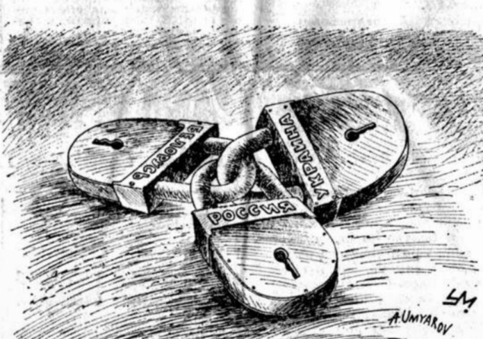
Рисунок Александра Умарова.

возможным, в то же время явно не хотел вообще остаться без какого-то межреспубликанского объединения. Кравчук, как раз и не стремившийся подписывать Союзный договор, не хотел в то же время излишних осложнений на восточных границах. Поэтому неудивительно, что обе претендующие на существование геополитическую роль стороны избрали центром грядущего содружества Минск — столичный град третьей стороны, явно тяготеющей и к Украине, и к России и оказавшейся в результате «буфера» между ними. И тому же в результате создания нового содружества, явно претендующего на правопреемственность по отношению к бывшему Союзу, но не стремящегося стать государством со всеми вытекающими отсюда последствиями, президент Михаил Горбачев явно оказывается не у дел, лишенный к тому же возможности возражать, это как будто бы и сохранение единства, за которое он так ратовал, но без него. Способен ли, интересно, Горба-