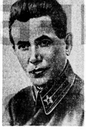
рублики страны, возможен ли вообще подобный прогреб по пересеченной местности, бездорожье, снег и льду, да еще на расстоянии свыше 30.000 километров... такие впрямую никто не задавал. Квадратные лейтенанты, зарабатывая по ордену Красной Звезды за соучастие в грандиозной велофантазии своего вождя, упрямо таранились в объектив фотоаппарата на торжественном приеме у маршала карательных войск.