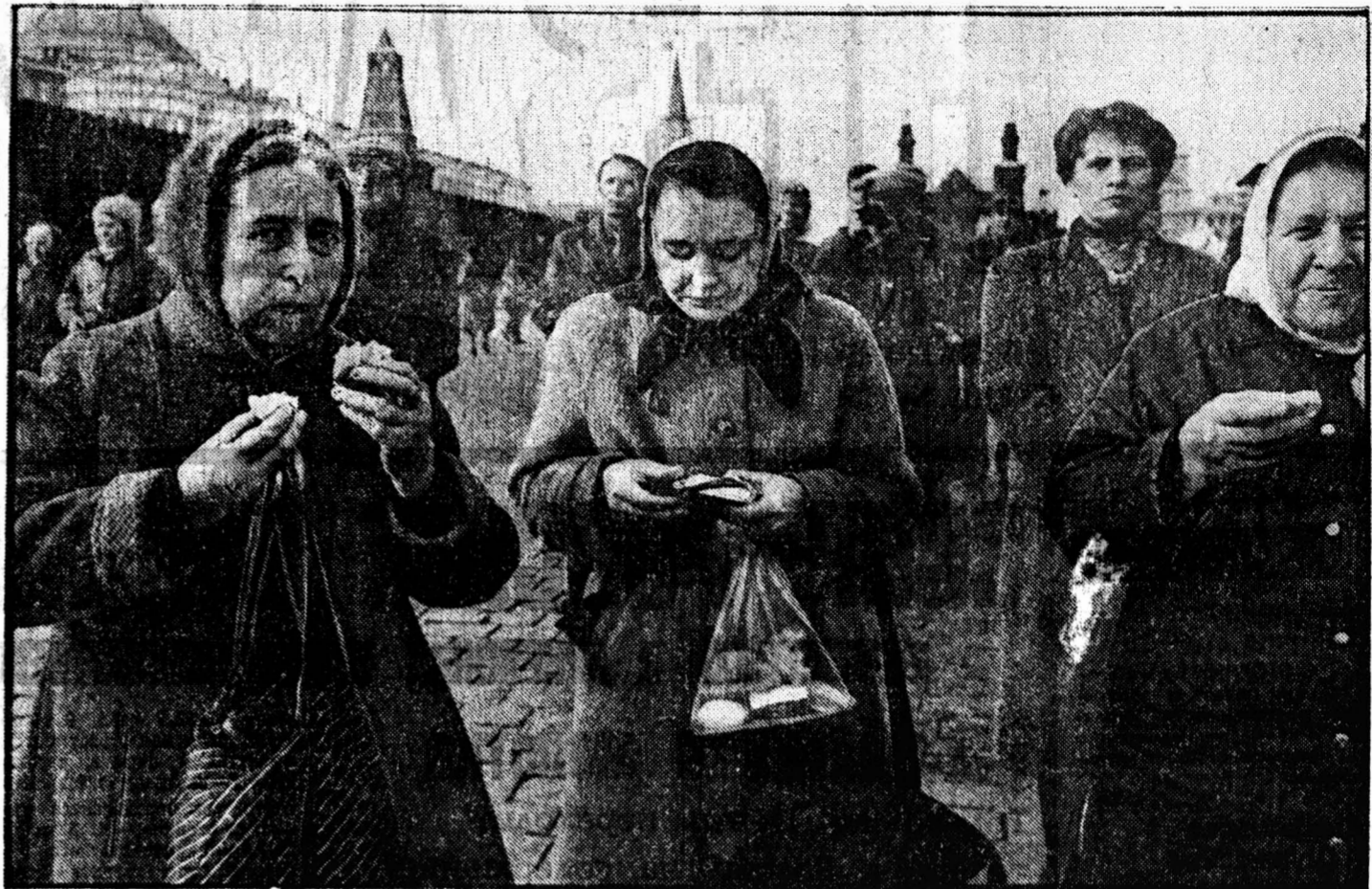
Москва. Декабрь 1991-го.

РУКОВОДСТВО АФТ—КПФ (Американская федерация труда — Конгресс производителей профсоюзов) потребовало от правительства США немедленного признания независимости Украины.