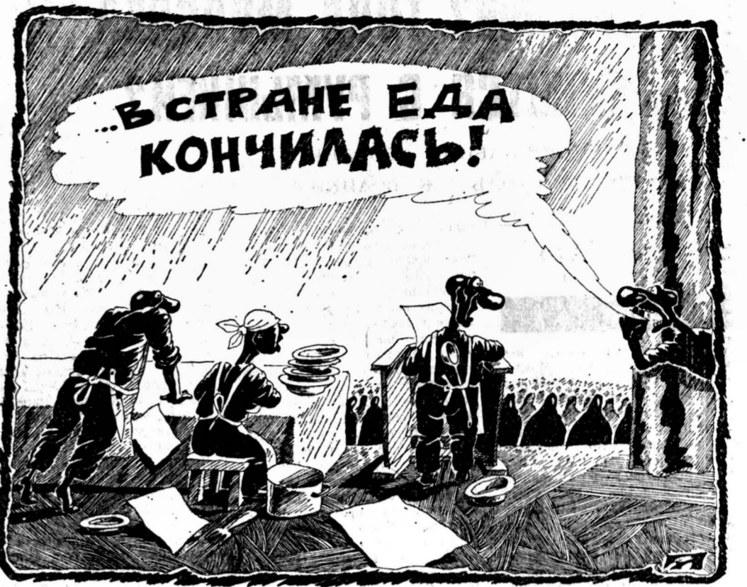
Рисунок Алексея Мерзюкова.