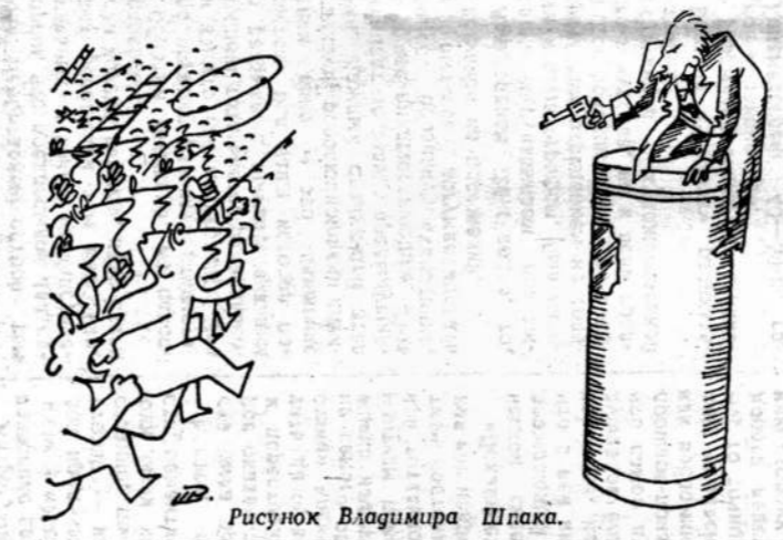
Рисунок Владимира Шпака.

3 ДЕКАБРЯ 1967 — Профессор Кристиан Барнард провёл в Кейптауне первую в мире операцию по пересадке сердца (большой — Луис Вазански).