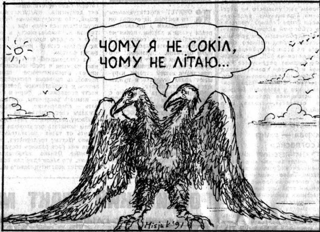
Рисунок Вагима Мисюка.

Около 75% населения Крыма — 1 млн. 7 тыс. человек из об-