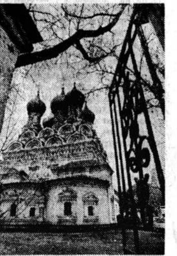
Церковь Николая в Пыхах.

за собой появление специального письма Комитета по свободе совести РСФСР о том, что собрано проведено с многочисленными нарушениями и не может считаться правомочным, а следовательно, результаты его недействительны.