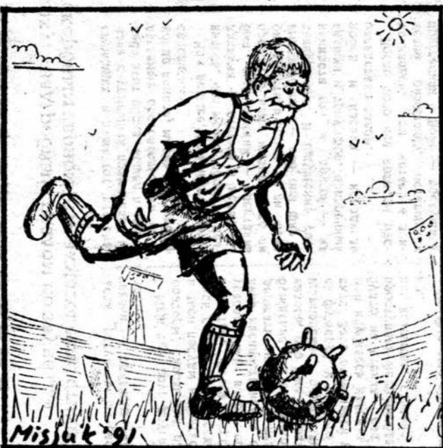
Рисунок Вагима Мисюка.