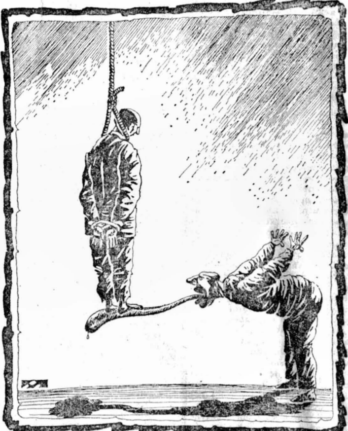
Рисунок Алексея Мерина.

К концу второго дня родился проект постановления «О ситуации с именованной в стране в связи с именованным переворотом». Уродливый и огромный, почти четыре с половиной страницы. Однако об этой самой «ситуации», как она есть, в нем не найти и слова. Путь грубо опрокинул конструкцию и так неустойчивого политического баланса, соорудив новую в ходе ново-огаревских консультаций. Кремлевские затворники оказались погребенными