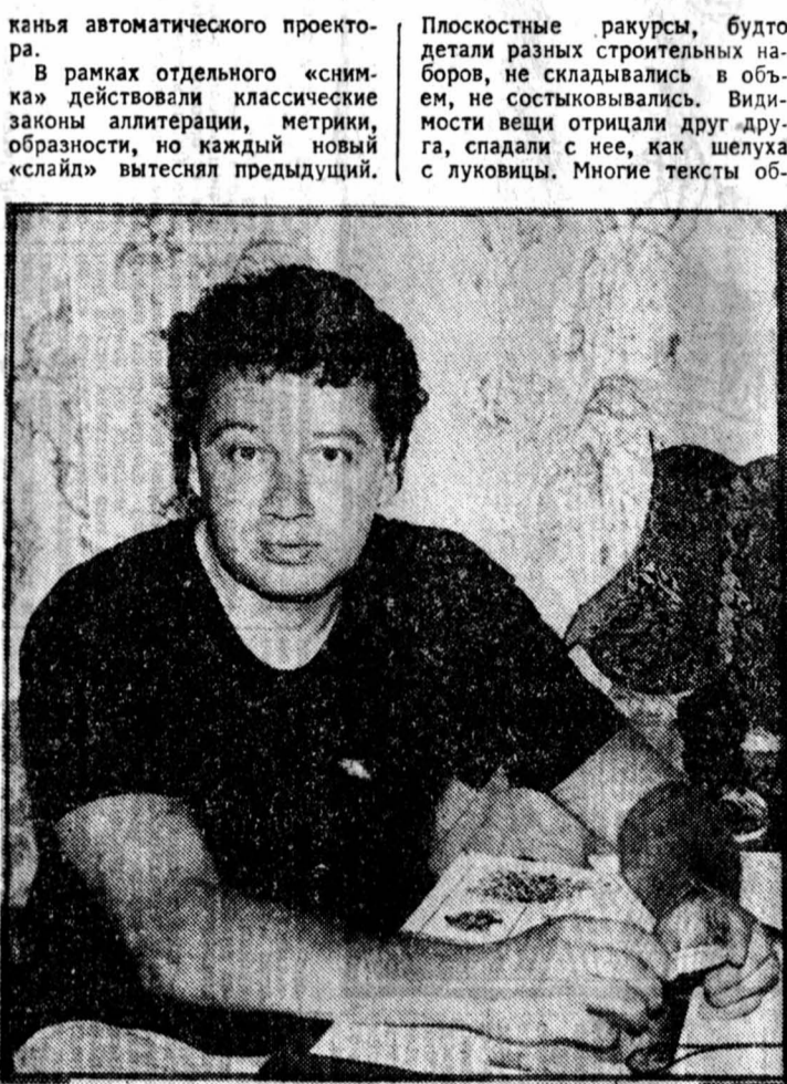
Алексей Парщиков.

не успев по-настоящему стать фактом печатной литературы, превращается в литературный миф. Во всяком случае, это не считалось поводом для печали. Константин Кедров красиво окрестил «сложную» поэзию «метаметафорической». В дальнейшем термины придумывал Михаил Эпштейн: «метаморфоза», «метаболоз». Концепции теоретиков покорили нарастающей строгостью. Они достигли такого изящества, что могли существовать сами по себе. Независимо от разбираемых произведений. Не потому ли для широкой публики Алексей Парщикова, например, так и остался автором «кощунственной» строки о море, похожем на свалку велосипедных рулей? Именно ее почему-то полюбили цитировать участники газетных дискуссий.