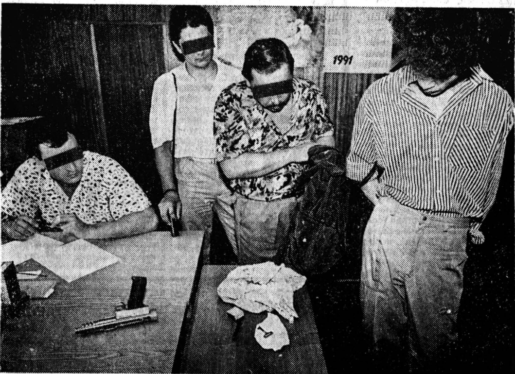
Сотрудники оперативной группы с задержанным «оружейником» (крайний справа).

Задержана банда подпольных оружейников. Преступники получают новые автоматы — «Узи» по-одиноцки