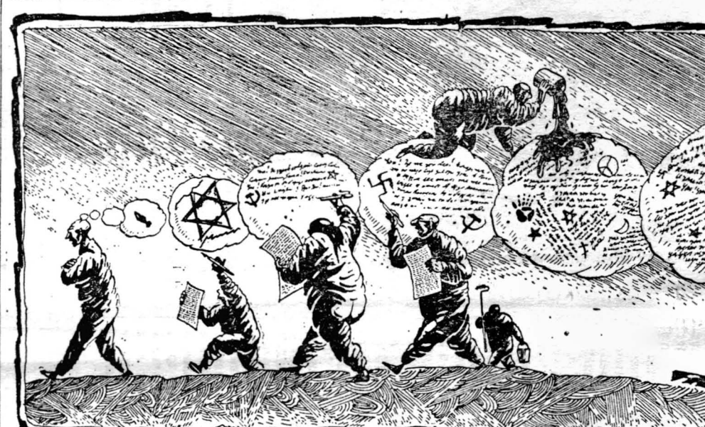
Рис. Алексея Мершова.