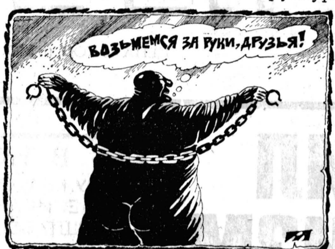
Рисунок Алексея Меримова.

А ситуация отнюдь не такая уж радужная. В большинстве республик и в центре власть по-прежнему находится в руках КПСС. Подавляющее большинство краев, областей и республик Российской Федерации контролируют