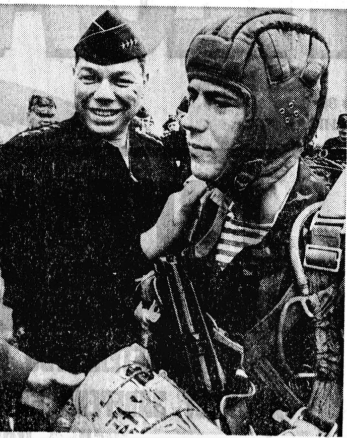
Генерал Пауэлл и советский генерал.

Стратегические силы планируются сократить в соответствии с новым договором по СНВ. Будет существенно сокращено число военных баз и объектов, как в США, так и в Европе и Азии. Генерал Пауэлл отметил, что с авиабазы Кларк на Филиппинах уже выведены эскадрилья жетрейсеров Бардольфики, а в 1992 году ее совсем закроют. (Базу, как известно, засыпало вулканическим пеплом, и восстановить ее не представляется возможным). Американские военные столкнулись с трудностями при разоружении резервистов формирования во время войны с Ираком, так что именно резервисты и