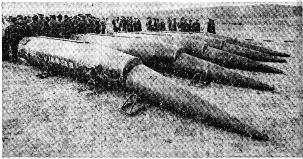
Казахстан. Сарылок. Ракеты перед уничтожением.