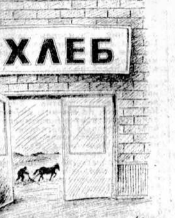
Рисунок Александра Умарова.

И думается, что министр сельского хозяйства и продовольствия Г. В. Кулик совсем не случайно отказался обсуждать вопрос об обязательности проданного — признав тут же, что «на местах» развернувшиеся мощные процессы его самовольного сокращения. Уже сегодня местные власти собираются отнять у государства не 31, на который рассчитывают руководители отрасли, а лишь 27 млн. т зерна. Реальная же величина проданного будет еще меньше, так как ее предполагается «корректиро-