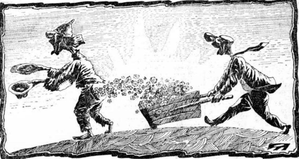
Рисунок Алексея Меримова.

Очередная сделка с «Де Бирс» справляет свою годовщину