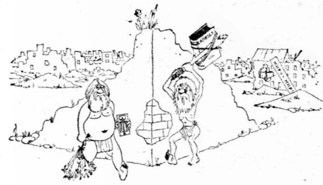
Рисунок В. Плотникова.