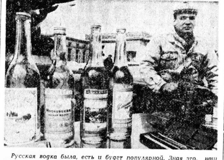
Русская водка была, есть и будет популярной. Знает это, наш соотечественник делает хороший бизнес в центре Варшавы.

ПОВОДОМ для этого репортажа — расследования послужили слухи о том, что виски и градус у водки нынче не тот, а чтоб «сшибала», добавляют в нее димедрол — лекарственное средство, обладающее успокаивающим и снотворным действием.