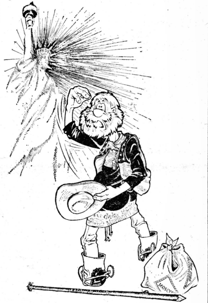
Рисунок Сергея Смирнова.

Под особой культурой теперь понимается не только национальная специфика, но всякая: расовая, возрастная, половая, физиологическая и т. д. О том, что англоязычную культуру не следует превозносить над испаноязычной или что ирландцы не уступают в своем культурном достоинстве итальянцам, — об этом и споры нет, настолько равноправие и взаимоуважение здесь очевидны.