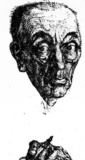
М. М. Бахтин. «Из русской думы», 1972. Офорт.