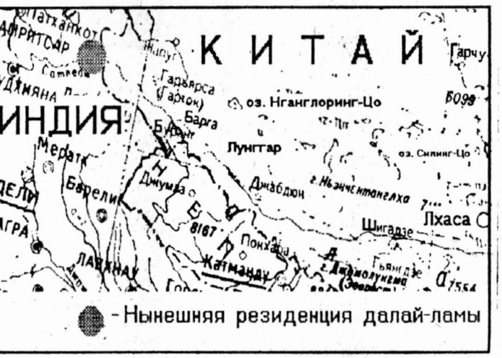
— Нынешняя резиденция далай-ламы