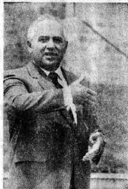
Михаил Горбачев — отец забытой идеи безъядерного мира к 2000 году.