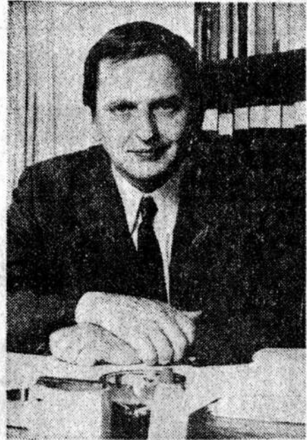
Улоф Пальме — покойный отец покойной идеи безъядерного «коридора».

Есть еще одна — правда, изрядно забытая — тема в этой связи. Без малого десять лет назад правительство Швеции выступило с предложением о создании в Центральной Европе зоны, свободной от ядерного ору-