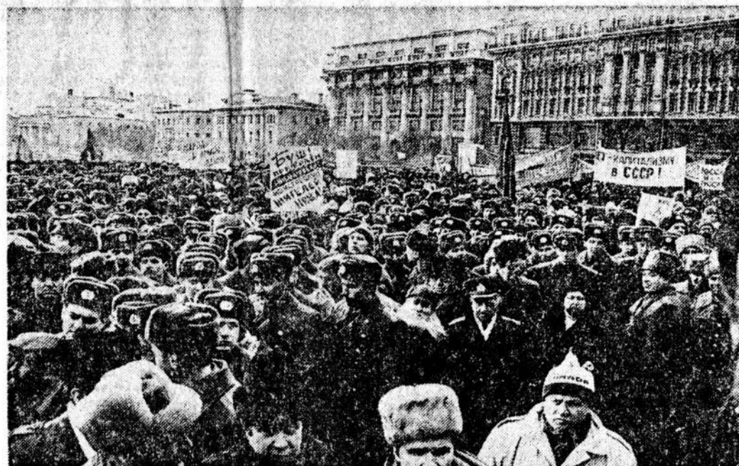
Во время митинга 23 февраля.