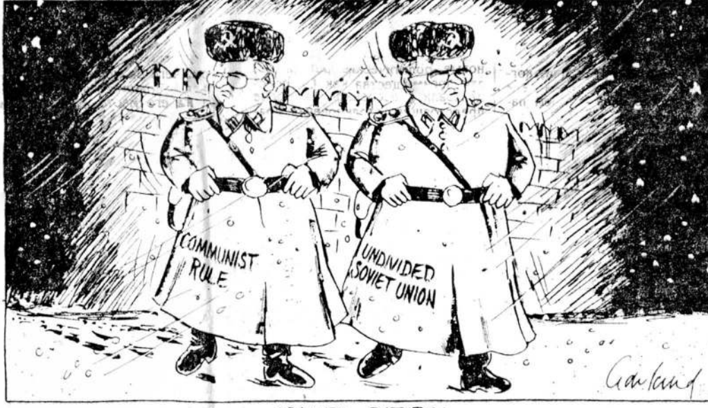
Карикатура из газеты «Инженер» (Донецк). На Горбачевых написано: «Коммунистическое правление», «Единый Советский Союз». Подпись под рисунком: «Совместное патрулирование». Кто же предлагает полковник Алексис изменить?