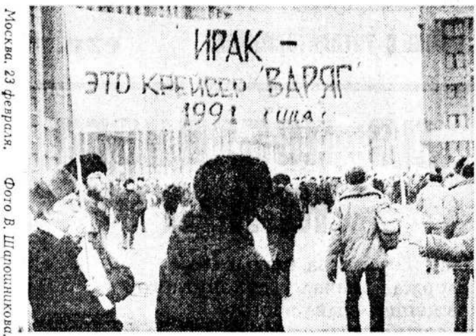
Москва, 23 февраля.