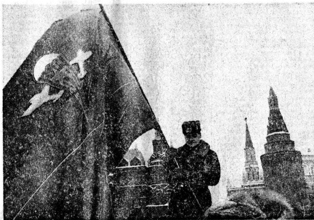
Флаг Воздушно-беспилотных войск над Манежной площадью, называемой многими «площадью Свободы».