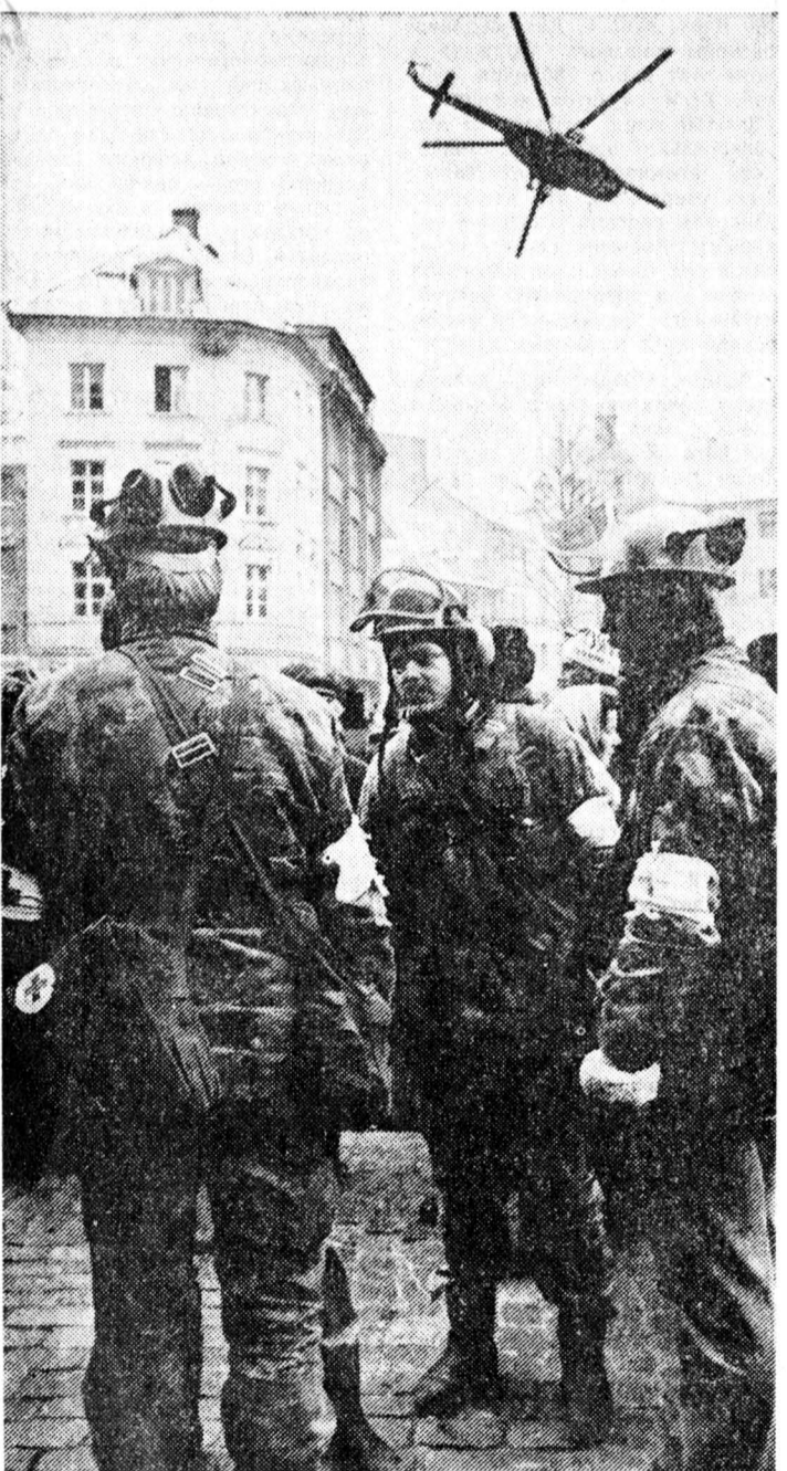
Рига. Отряды самообороны на площади Домского собора.

Предсовмина Латвии Годманис. 16 января 1991 г.