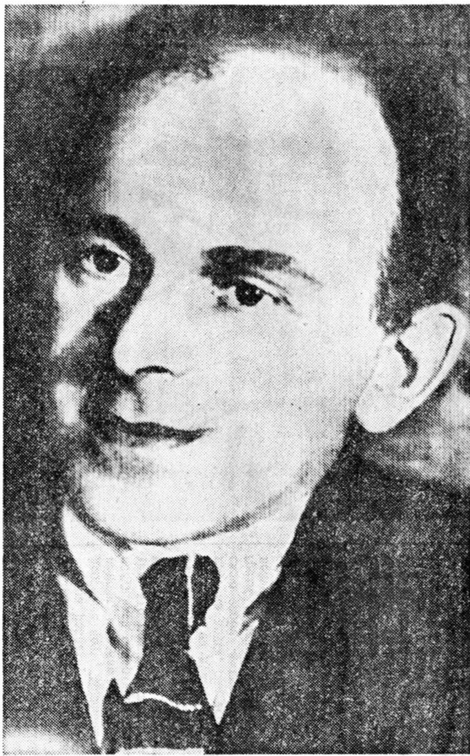
надевается космическим характером:

Смерть Петербурга — Петрополя (это поэтически-пушкинское название города выявляет его вневременную сущность)