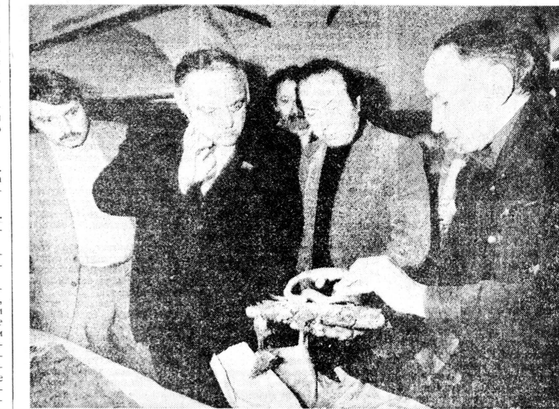
За неделю до ареста.