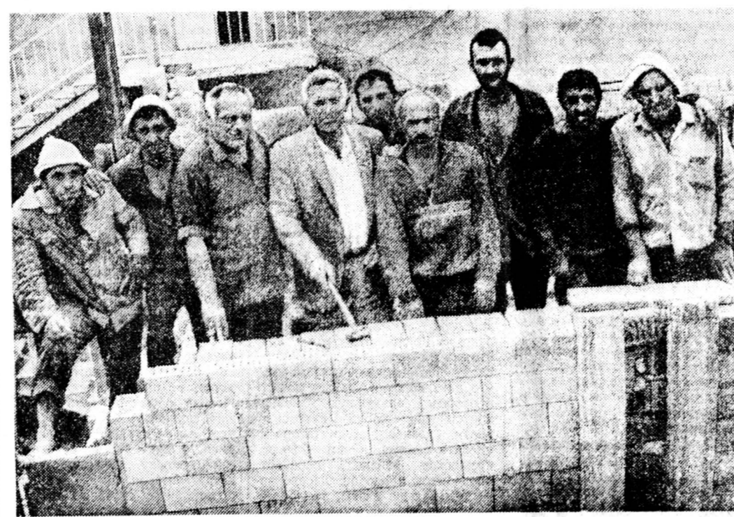
Они строят храм.