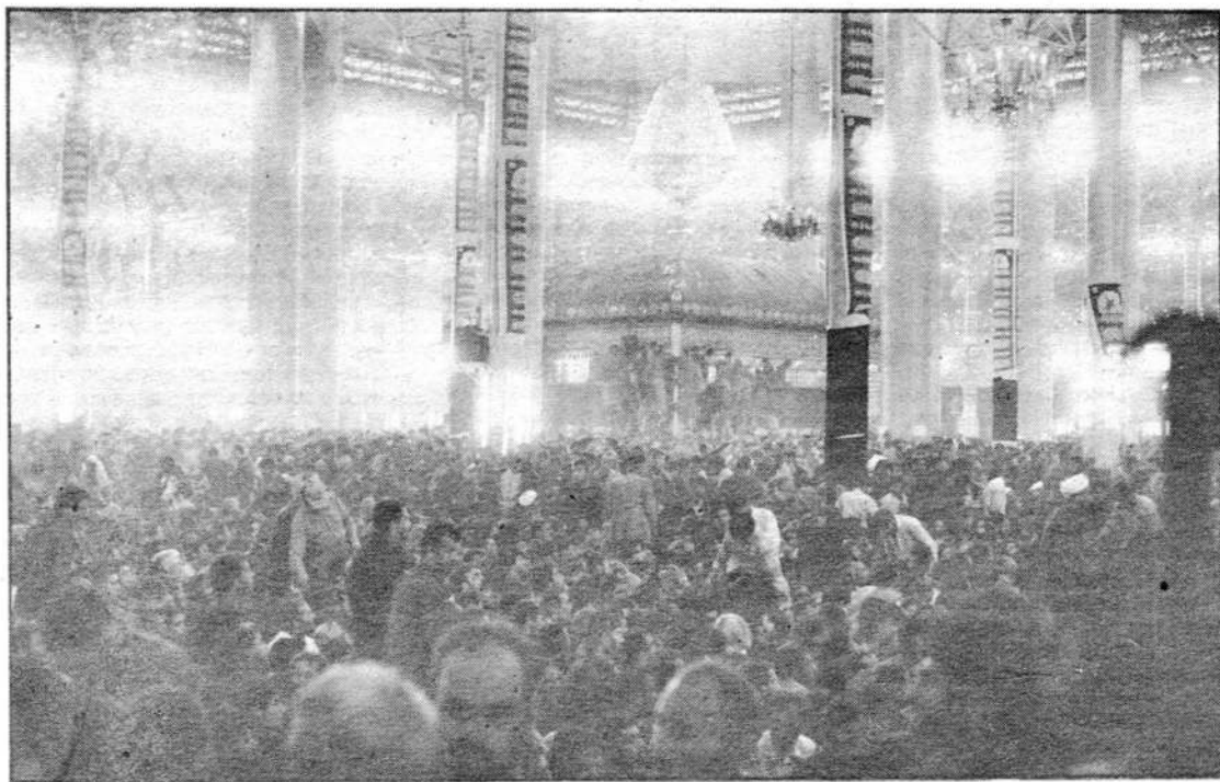
Траурная церемония в мавзолее.