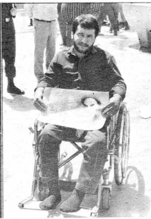
Парализованный участник войны с Ираком.