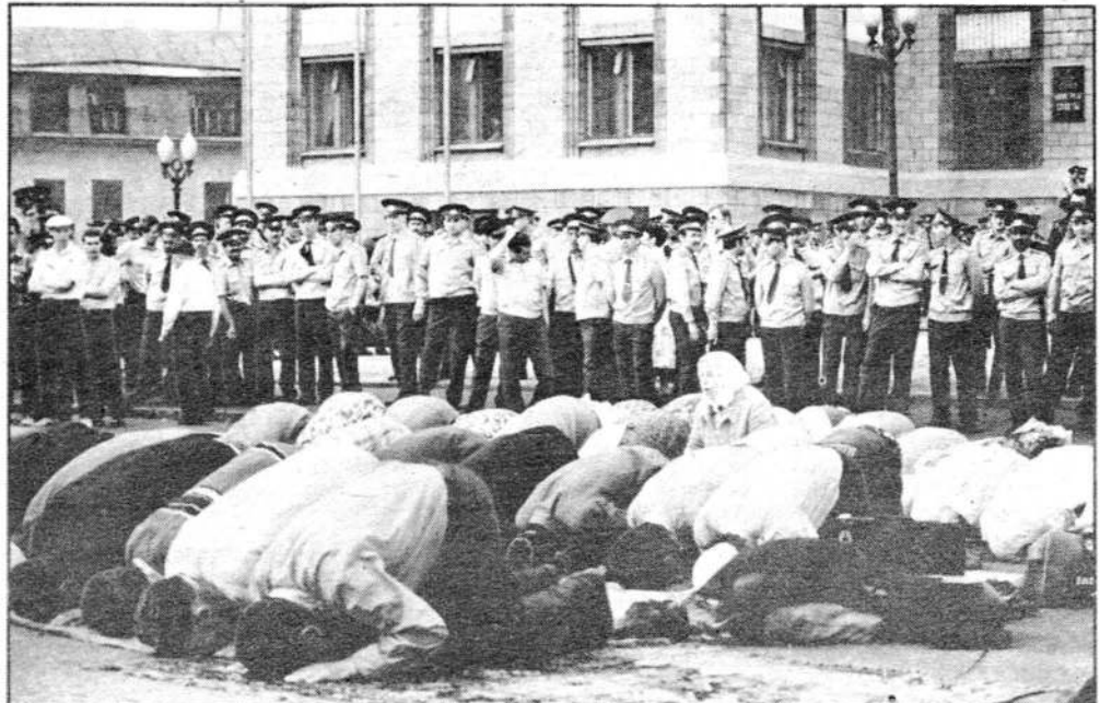
Казань. Площадь Свободы. Намаз по ходу митинга.

«Особое мнение» Татарстана, похоже, становится сегодня одним из препятствий на пути подписания союзного договора. «Я ни на миллиметр не изменил своей позиции», — так заявил, вернувшись в Казань из Ново-Огарева, президент республики Минтимер Шаймиев.