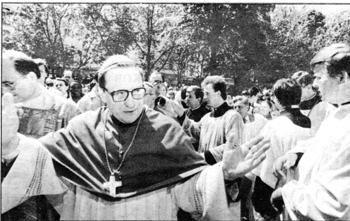
Церемония интронизации апостольского администратора Москвы и Европейской части РСФСР архиепископа Тадеуша Кондрусевича. Ранее он возглавлял католиков Белоруссии.

Жарким летним днем нынешнего года я стоял во дворе московского костела Святого Людовика на Малой Лубянке, построенного полтора с лишним века назад по проекту знаменитого Жиларди, и наблюдал за интронизацией первого в истории России католического архиепископа Москвы и Европейской части РСФСР Тадеуша Кондрусевича. Двор был полон народа, все слушали папскую буллу, посвященную этому событию, приветствия в адрес архиепископа и его торжественно-взволнованное слово.