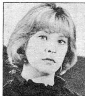
Татьяна ДОГИЛЕВА, актриса

А время идет. Жизнь одна, и профессию менять не хочется.