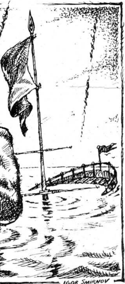
Рис. Игоря СМЕРНОВА.

Оригорий ЯВЛИНСКИЙ: Анализ показал, что речь идет не о таких уж больших суммах. Скажем, США придется вложить в программу всего один процент от военных расходов. Если же удастся привлечь к сотрудничеству не только «семерку», а, скажем, 24 ведущие промышленные державы, то будет еще легче.