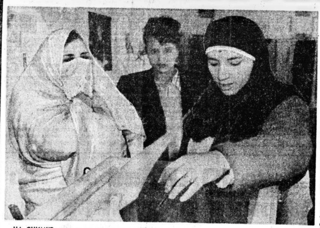
НА СНИМКЕ: алжирские женщины принимают участие в выборах.

Результаты состоявшихся 26 декабря в АНДР первых в истории страны выборов на многопартийной основе в Национальное народное собрание продолжают занимать видное место в комментариях мировой печати. Около пяти тысяч кандидатов от 49 партий, а также независимые политические деятели оспаривали 430 мест в алжирском парламенте. Для победы в первом туре выборов соперничавшим партиям необходимо было получить 216 депутатских мест,