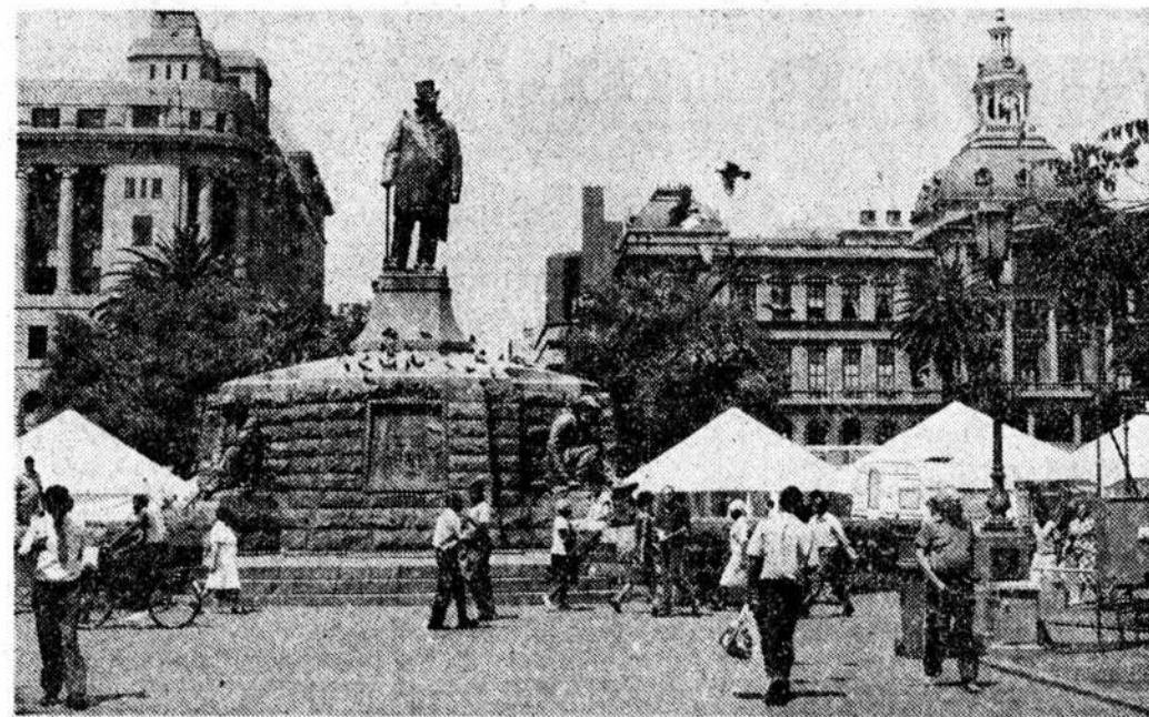
С 1961 года административная столица страны — Претория.

Уникальная кладовая подземных ископаемых, государство само-го развитого на африканском континенте индустриально-аграрного потенциала и инфраструктуры, земля, на которой живут и трудятся представители всех рас и многих народов, край красивейших и неповторимых ландшафтов природы.