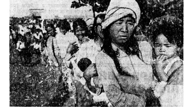
Первые группы камбоджийских беженцев возвращаются домой...

Большие надежды возлагаются на бывшую метрополию — Францию, которая, как пишут газеты, охвачена стремлением «реанимировать свое влияние в Индокитае. Из трех стран этого полуострова у франков, видимо, отдают предпочтение именно Камбодже. Во всяком случае завершившийся визит заместителя французского министра индуст-