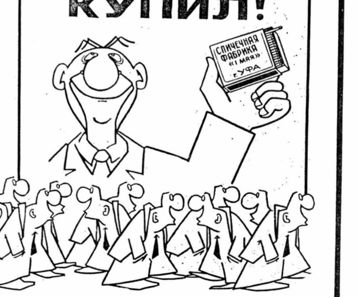
Рис. Ю. БОРЯКИНА.

Он призвал КНДР отказаться от собственных ядерных разработок, подчеркнув, что Сеул полностью выполнил свои обязательства по превращению Корейского полуострова в безъядерную зону.