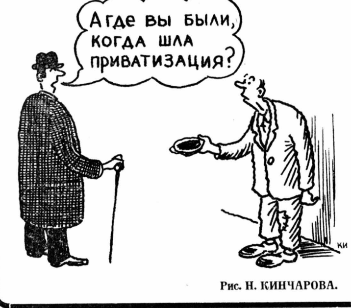
Рис. Н. КИЧАРОВА.

Соединенные Штаты полностью вывели свое ядерное оружие с юга Кореянского полуострова. Об этом сообщает сегодня агентство РЕНХАП со ссылкой на неназванного высокопоставленного представителя правительства Южной Кореи.