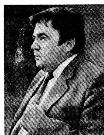
Мирча Снегур, Президент Молдовы