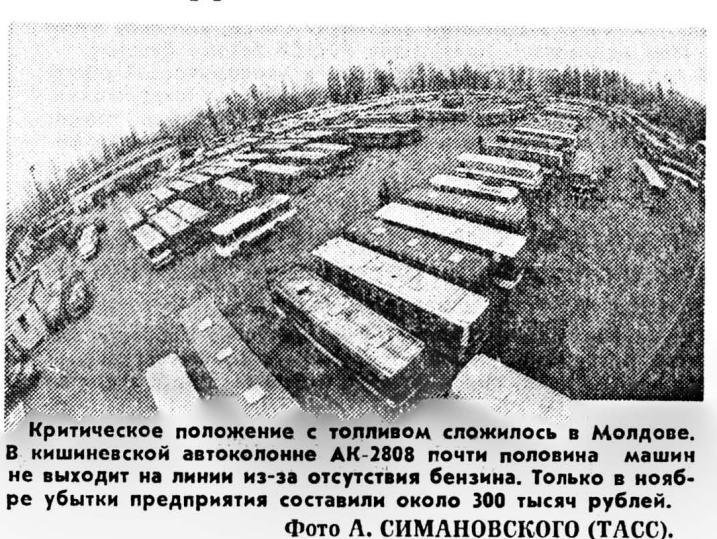
Критическое положение с топливом сложилось в Молдове. В кишиневской автоколонне АК-2808 почти половина машин не выходит на линии из-за отсутствия бензина. Только в ноябре убытки предприятия составили около 300 тысяч рублей.