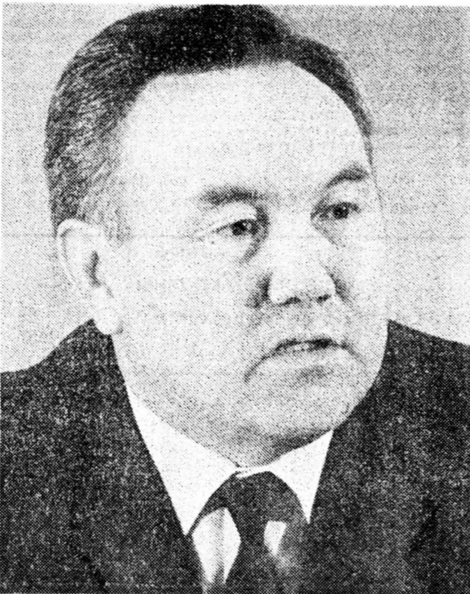
Даже если бы в 1985 году не начались преобразования советского общества, все равно мы бы узнали о Нурсултане Назарбаеве — он и при коммунистическом режиме не затерялся бы. Но только перестройка позволила раскрыться истинным чертам его натуры: независимость суждений и поведения, прагматич-

ный подход к решению политических и экономических проблем, умение поставить себя на место других. Назарбаев выделяется среди государственных руководителей республики, которые раньше составляли СССР. Феномен Назарбаева еще во многом не разгадан. Иногда кажется, что в Казахстане ничего не происходит. Ничего не слышно о приватизации жилья или торговли, похоже, там не раздаются на колхозы и совхозы, не доносятся до Москвы и споры вокруг вывоза: что делать с пресмысленными предприятиями. Компания в республике почти сохранила, хотя она формально ушла с политической сцены. Межнациональная напряженность если и есть, то все-таки она не выливается в прямые столкновения, хотя национальный состав республики очень сложный и коренное население не составляет большинство. Если в Казахстане время от времени возникает социальное противостояние, как это случилось во времена шахтерских выступлений, то опять же оно быстро рассасывается. В прошлом году шахтеры Караганды выступили с весьма радикальными лозунгами. Приехал Назарбаев и под свое честное слово попросил не прерывать выдачу угля. Шахтеры его послушались. Судя по всему, Назарбаев избрал эволюционный путь ре-