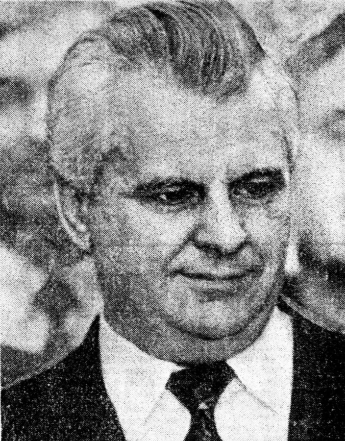
Почему народ Украины избрал своим президентом Леонида Кравчука? Однозначно могу сказать, что отнюдь не благодаря его предвыборной программе,

привлекательной. Но массы предпочли все же Л. Кравчука — человека, чья биография партизанского партизана с тридцатилетним стажем никак не могла конкурировать с жизненным путем его соперников-демократов, за плечами которых были и тюрьмы, и ссылки, и непоколебимость в верности своей идее. Что же стоит за фактом безусловного признания Л. Кравчука лидером? Мне кажется, что в борьбе с пятью другими претендентами Л. Кравчук победил потому, что сегодня его имя связывают не с некоей политической идеей или обещаниями, а с реальными делами. Примеры последних дней. Задумал Крым отделяться, напряжение достигло крайнего предела, поехал туда Л. Кравчук, и противостояние удалось если не снять, то приглушить. Созрела на Закарпатье идея автономии республики — Л. Кравчук, оценив на месте ситуацию, взвесив доводы, нашел решение в трансформации идеи политической автономии в план создания отдельного экономического района. Без применения болезненных мер ему удалось разрешить острые конфликты, назревшие в Донбассе и Причерноморье. Конечно, Л. Кравчуку помогала группа соратников хороших друзей, но, согласитесь, не много чужь политика, чтобы сводить противоречивые советы в решения конкретных политических