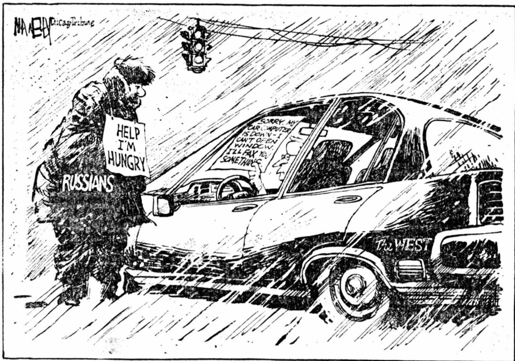
«Помогите, я голоден» — написано на плакате индуса у автомобиля с надписью «Запад». Водитель отвечает ему другим плакатом: «Прости, в машине испортился компьютер, и я не могу открыть окно. Пейте тебэ что-нибудь по факсу». Газета «Интернационал геральда трибун» этой карикатурой откликнулась на продолжающиеся в развитых странах споры о том, как лучше помочь Союзу нынешней зимой.