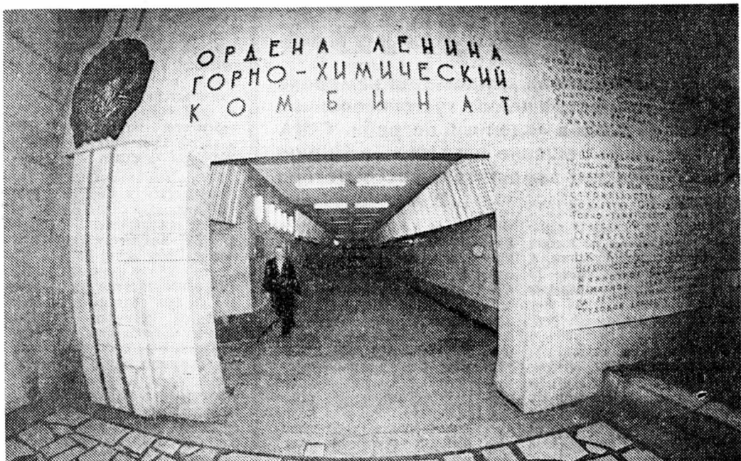
Орден Ленина Горно-химический комбинат

Это — первый репортаж из закрытого города недалеко от Красноярск. Здесь, на глубине 250 метров, расположена подземная атомная станция Красноярского горно-химического комбината. Станция находится в затухающем состоянии — на «выбеге». Ее полная остановка обусловлена инициативой высшего руководства СССР и России о прекращении производства делящихся материалов.