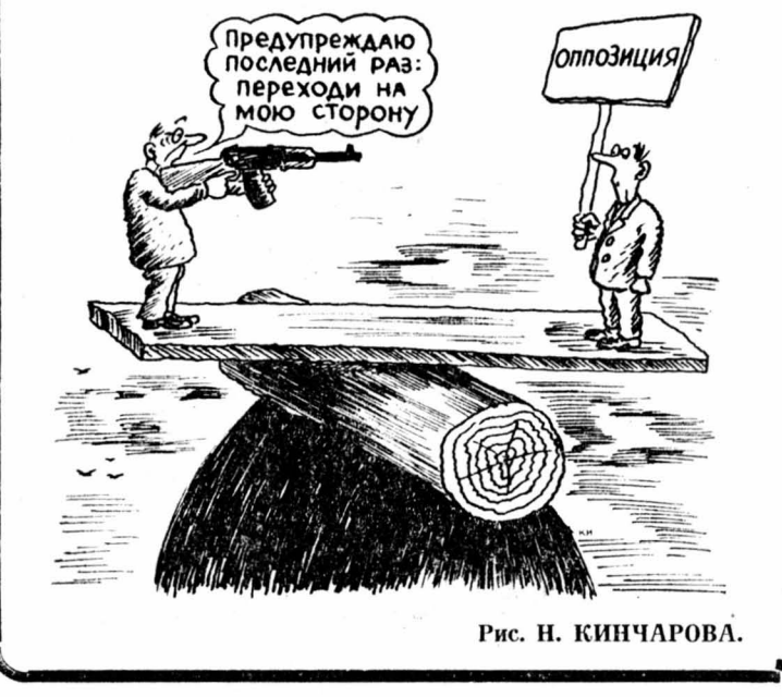
Рис. Н. КИНЧАРОВА.

По сообщению информационного агентства ДДП, в его распоряжении находится закрытый доклад правительства ФРГ комиссии бундестага по вопросам экономики, в котором, в частности, приводятся сведения об участии 15 германских фирм в «ракетной программе» Ирака.