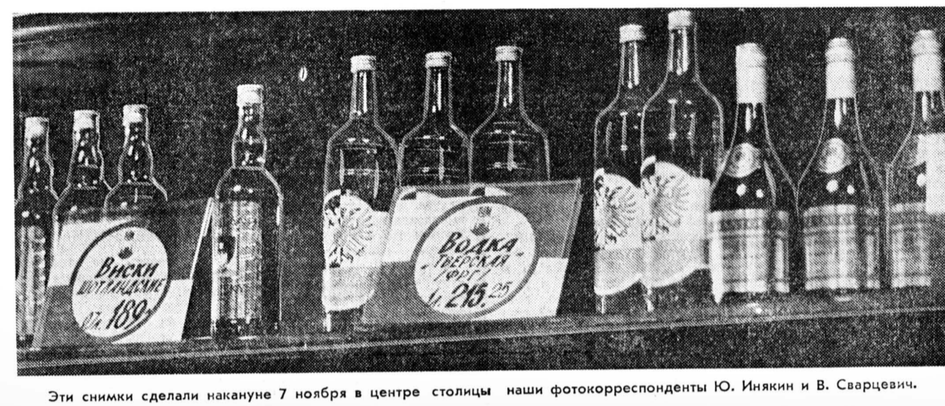
Эти снимки сделали накануне 7 ноября в центре столицы наши фотокорреспонденты Ю. Инякин и В. Сварцевич.