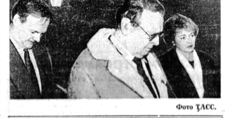
В. Илюхин.

5 ноября глава Российского императорского дома Великий князь Владимир Кириллович впервые ступил на землю России.