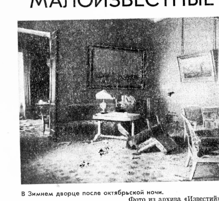
В Зимнем дворце после октябрьской ночи.

ВСЕ БОЛЬШЕ отделяется от нас ночь с 25 на 26 октября семнадцатого года, становясь из «символа новой эры» фактом истории. Мы освобождаемся от идеологического гнета и можем теперь трезво взглянуть на событие, которое, как всякое явление общественной жизни, не было и не могло быть однозначным. Пришла пора говорить о нем правду, независимо от того, приятна она или неприятна.