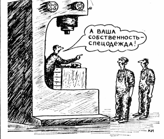
Рис. Н. КИЧАРОВА.