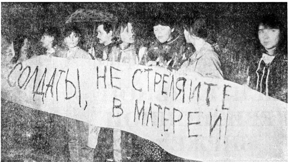
«Три дня. До и после» — так называется выставка, открывшаяся 6 сентября в выставочном зале Советского фонда культуры. Она организована фотохроникой ТАСС. Публикуем две фотографии из этой экспозиции — работы Юрия Лизунова и Сергея Мамонтова.