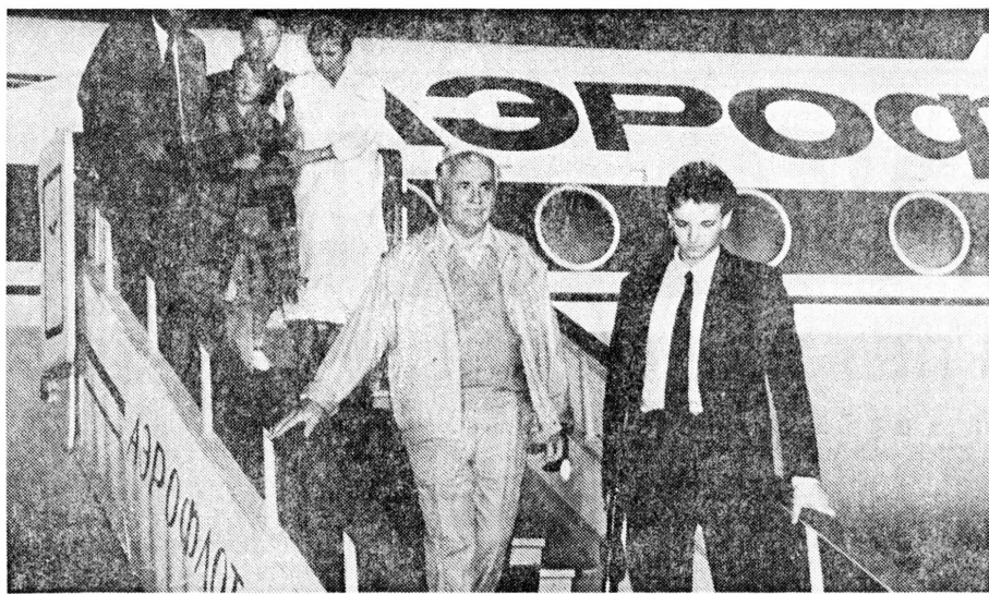
«Три дня. До и после» — так называется выставка, открывшаяся 6 сентября в выставочном зале Советского фонда культуры. Она организована фотохроникой ТАСС. Публикуем две фотографии из этой экспозиции — работы Юрия Лизунова и Сергея Мамонтова.

Ордена Трудового Красного Знамени типография «Известий Советов народных депутатов СССР» имени И. И. Скворцова-Степанова, Москва, Пушкинская пл., 5.