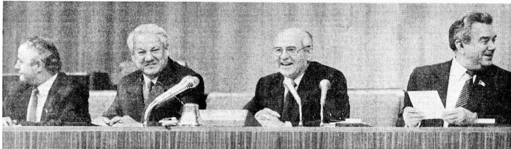
Сообщают парламентские корреспонденты ТАСС

В целях недопущения дальнейшего распада структур власти Съезд народных депутатов СССР объявил переходный период для формирования новой системы государственных отношений, основанной на волеизъявлении народов республик и интересах народов.