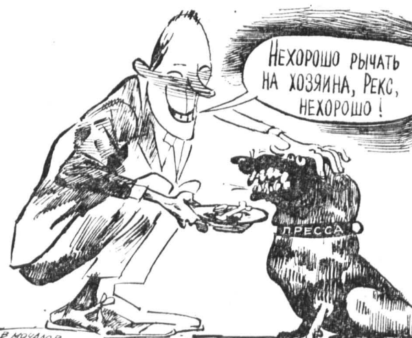
Рис. В. МОЧАЛОВА.

Госкомимущество России не передавал свидетельство о собственности на имущество издательства «Известия» Российскому фонду федерального имущества. Поэтому утвержде-