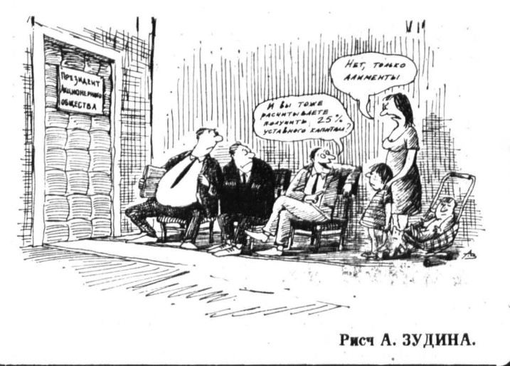
Рис. А. ЗУДИНА.

Оригинальный способ борьбы с бродягами придумали правоохранительные органы Миасса в Челябинской области. Всех бомжей, которые в течение дня появляются на железнодорожном вокзале, накапливают в отделении милиции и стрем направляют на электричку до Челябинска. Преступность на вокзале сведена к минимуму. Аксент.