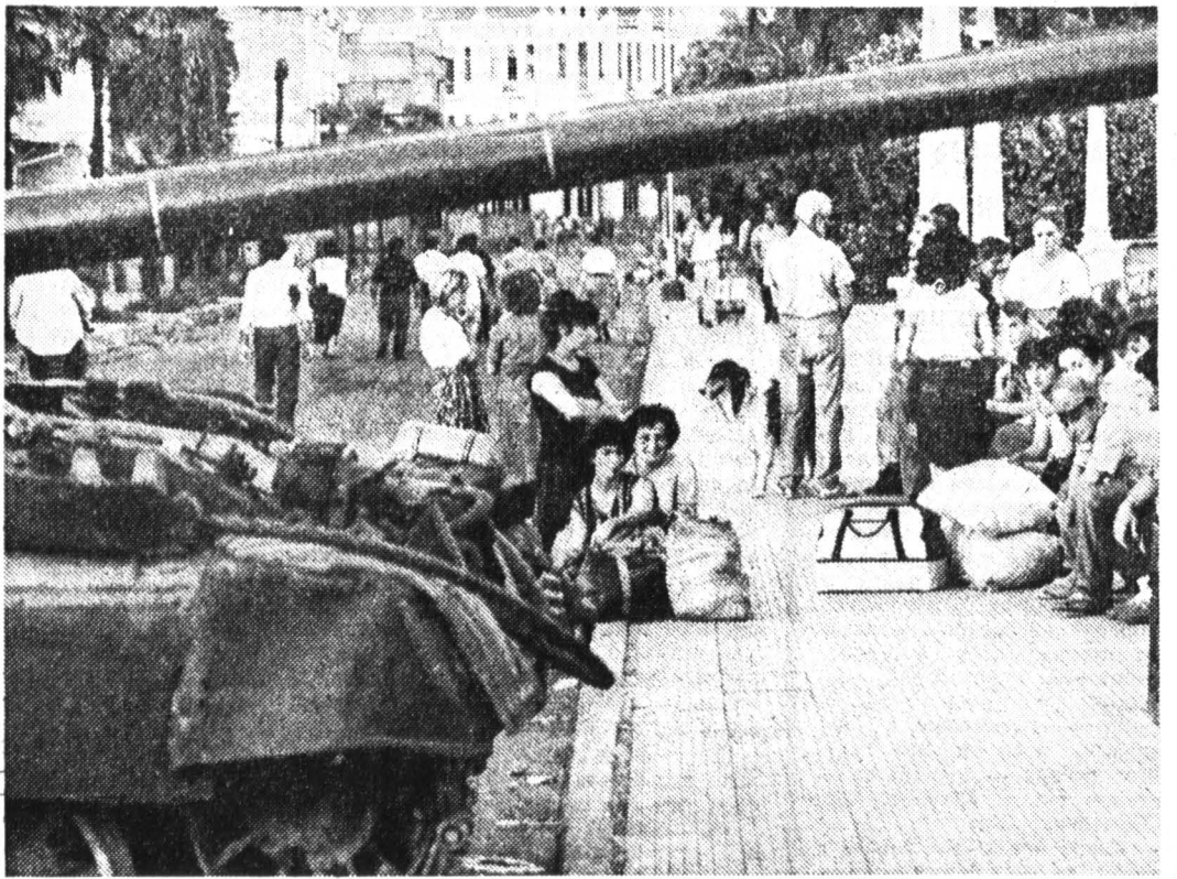
На снимке: Сухумская набережная.

(Окончание на 2-й стр. по заголовку «Горцы вступают в войну на стороне Абхазии...»).