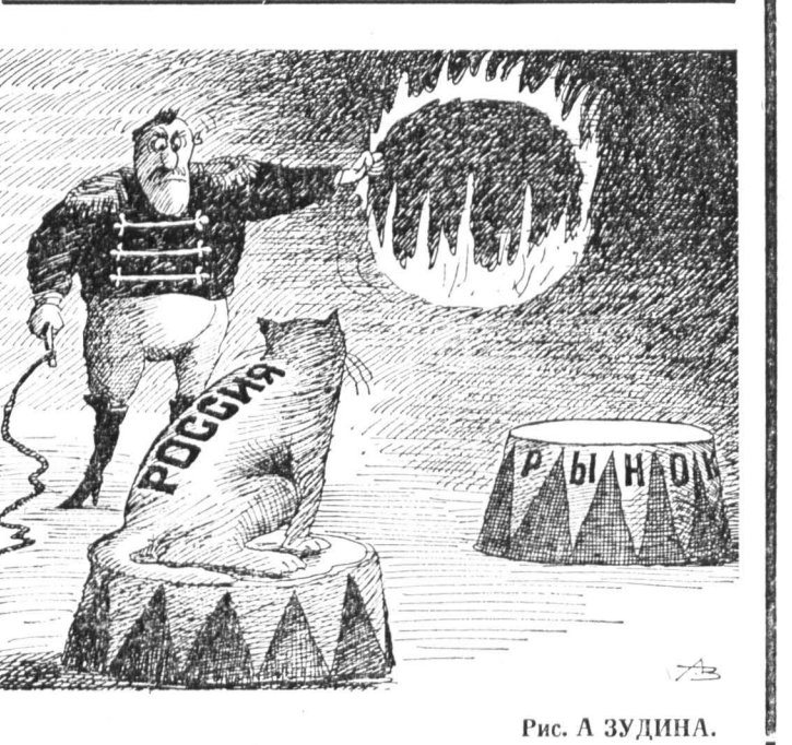
Рис. А. ЗУДИНА.