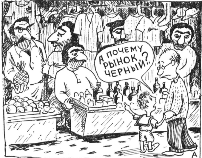
Рис. А. БОНДАРЕВА.

Идея создания в Петербурге специального комитета по чрезвычайным ситуациям обсуждалась и на закрытом совещании в Петросовете. Задачей комитета будет — не только (и может быть — не столько) ликвидация последствий стихийных бедствий, но и предотвращение социальных взрывов, массовых выступлений, всяческих провокаций. Инициатором этого совещания явился Петербургское управление безопасности: питерские чекисты «ввиду сложной экономической и политической ситуации не исключают отдельных социальных потрясений, в том числе и спровоцированных». Характерная деталь и петербуржцы в своих пересядах, и местная печать, говоря о необходимости создания комитета по ЧС, увязывают ее едва ли не в первую очередь именно с «омоновско-кавказским» конфликтом. Но никакого «заговора черных» на самом деле не существует. А есть множество преступных групп, подпольных Питер меж собой и устанавливающих в нем свой — интернациональный — беспредел. Чтобы обрушить этот «спрутам» шулла, нужна сильная милиция, которая бы не раздвинулась политиками всех рангов в разные стороны, не уводилась бы на кривые дорожки интриги, а имела бы возможность заниматься своим прямым делом: борьбой с преступностью. САНКТ-ПЕТЕРБУРГ.