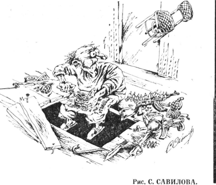
Рис. С. САВИЛОВА.

«Пусть лучше танцуют и поют, чем смотрят видео» — решили аксакалы села Карабаг на юге Киргизии после просмотра нескольких боевиков в молодежном видеокабаре. Заврив его, старики, правда, не оставили парней и девушек без развлечения: они убрались, и сами приобрели гитары, ударную установку, орган, другие инструменты для ансамбля. Кыргызы — ТАСС.