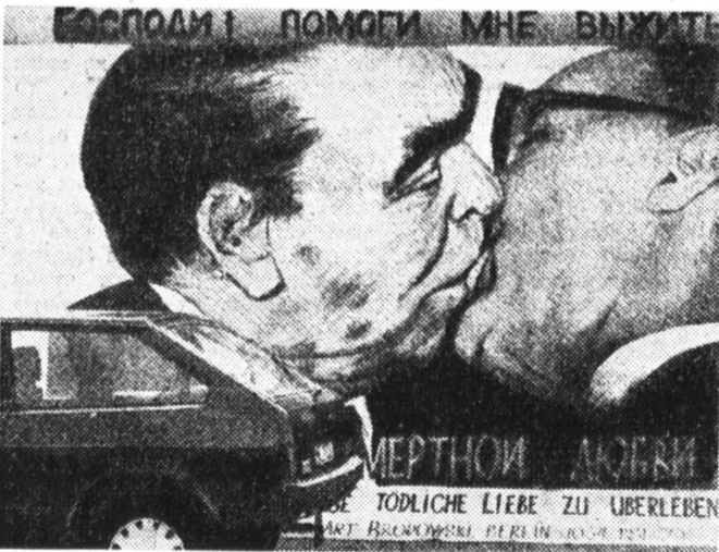
Рисунок на Берлинской стене.

Он преисполнен решимости усидеть на скамье подсудимых бывших советских и нынешних западногерманских политиков