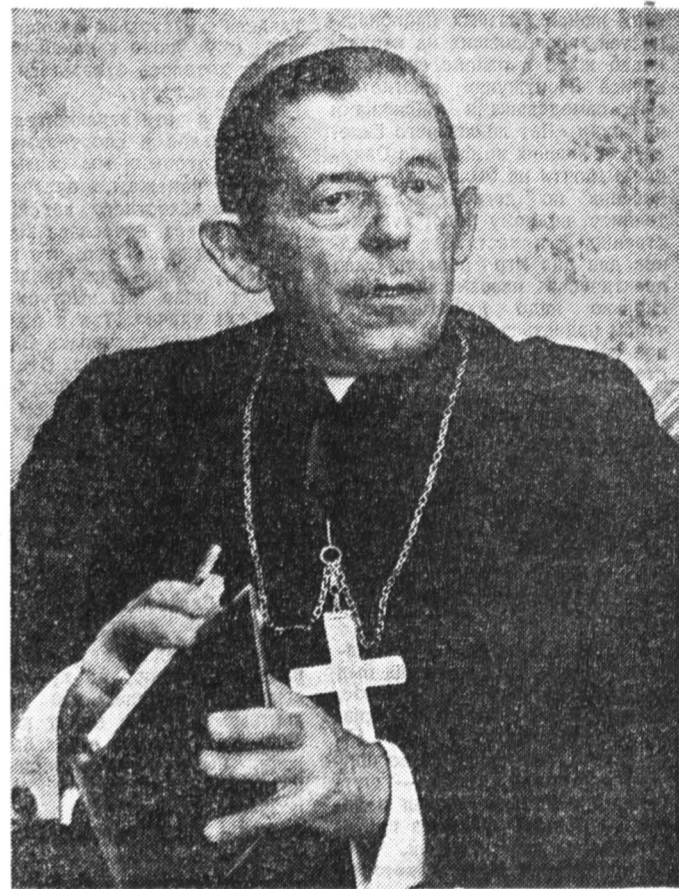
Кардинал Ю. Глемп