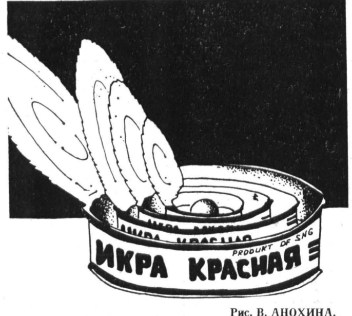
Рис. В. АНОХИНА.