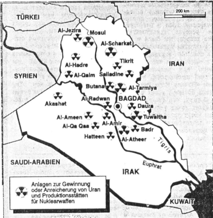
Эту карту Ирака опубликовал немецкий еженедельник «Цайт». На ней обозначены установки по переработке и обогащению урана, а также — мощности по производству ядерного оружия.