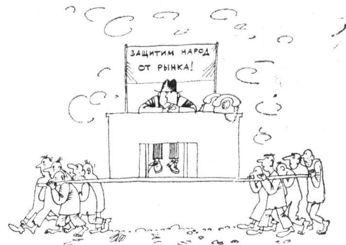
Рис. Т. ЗЕЛЕНЧЕНКО.

Недавно эта партия на своем съезде в подмосковном г. Пушкино исключила М. Горбачева из своих рядов. Интерфакс.