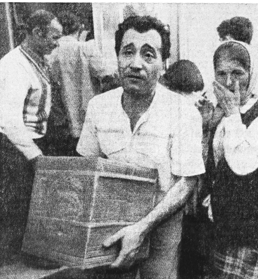
На снимке: из американской газеты «Интернешнл геральд трибюн»: житель города Саратого с коробкой с продовольствием в пункте раздачи гуманитарной помощи, доставляемой в Боснию и Герцеговину по линии ООН.