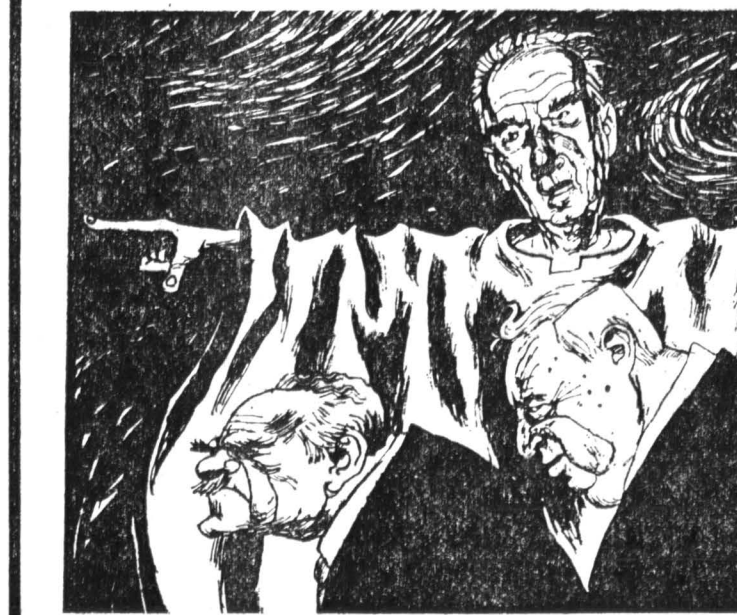
На рисунке из английского журнала «Экономист»: Ицхак Рабин указывает на дверь бывшего правительству блока «Ликуд».

Пятнадцать лет назад арабские лидеры уже получили приглашение посетить Израиль от премьер-министра М. Бегина. Но ответить на него в то время отказался лишь тогдашний президент Египта А. Садат, посетивший Иерусалим в ноябре 1977 года и выступивший в кнессете. Результатом этой поездки стало подписание в 1978 году соглашения в Кэмп-Дэвиде и установление мира между Египтом и Израилем.