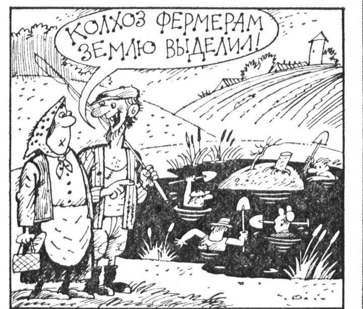
Рис. В. УБОРЕВИЧА-БОРОВСКОГО.