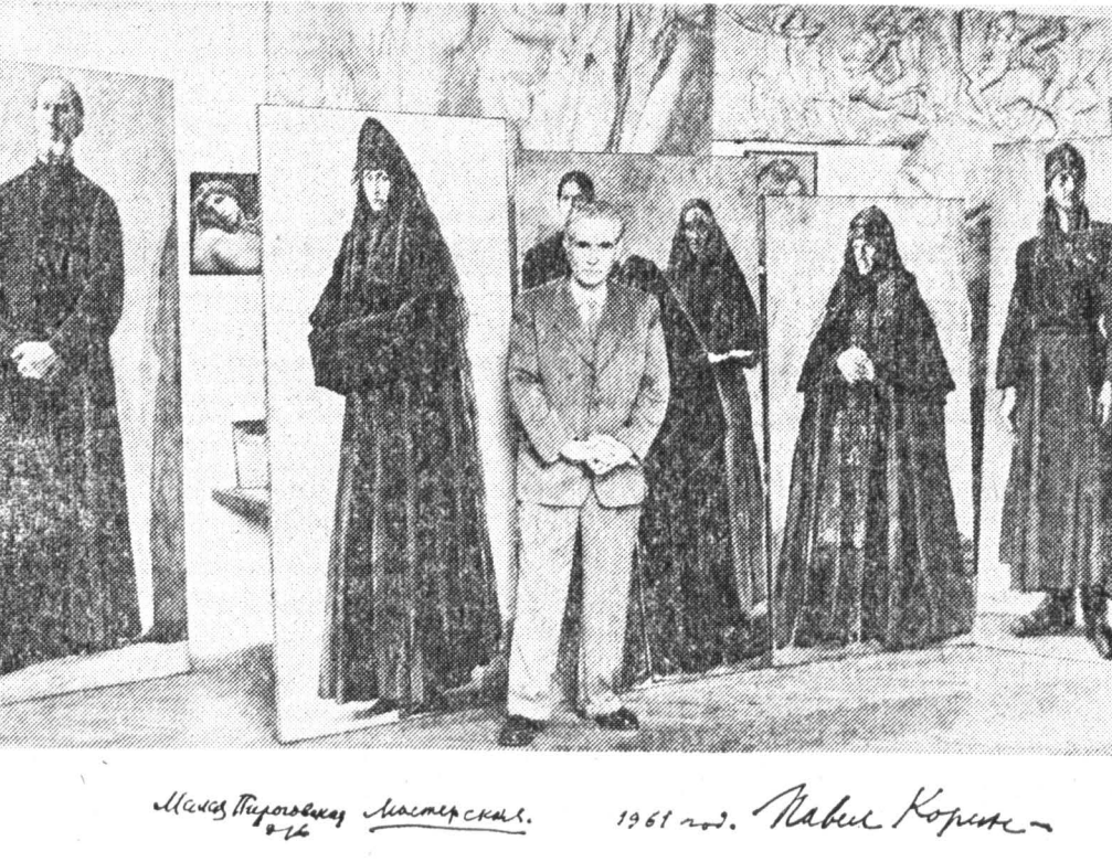
Михаил Васильевич Нестеров. 1961 год. Павел Корин