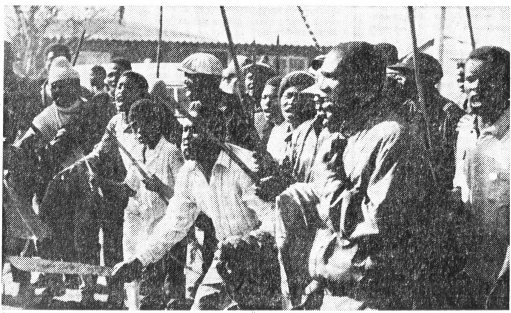
Сергей МУШКАТЕРОВ, «Известия»

На президент ЮАР, на высокопоставленные члены правительства, на силы безопасности прямо не причастны к эскалации насилия в ЮАР.