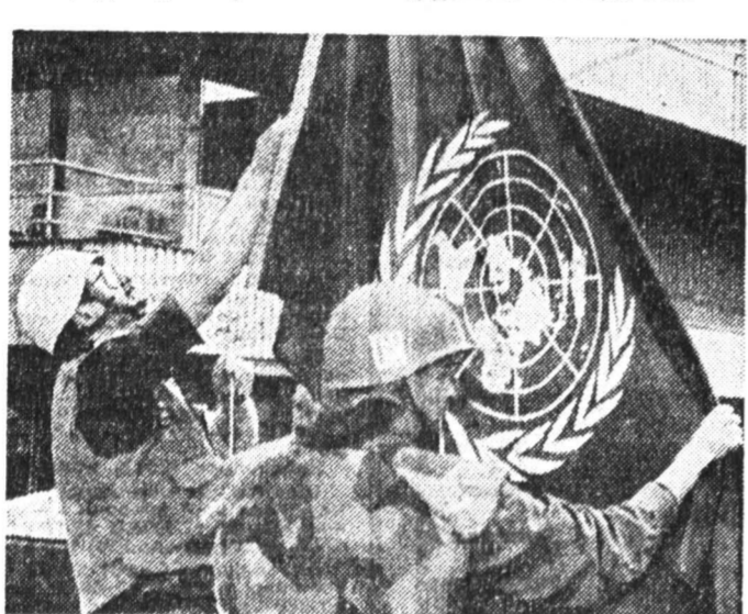
«Голубые каски» поднимают флаг ООН.

Меж тем в сараевский аэропорт «Бутрич» продолжает бесперебойно поступать гуманитарная помощь. Страны Европейского сообщества решили в этих целях организовать «воздушный