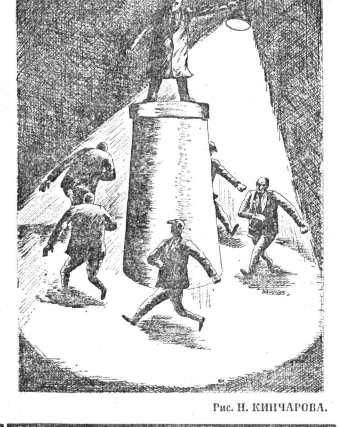
Рис. Н. КИНАРОВА.

мог испытать на себе взгляд Петра Ильича Чайковского (с портрета на сцене) и «услышать» одну из его потаенных мыслей, записанных в дневнике композитора в 1888 году: «Жизнь проходит, идет к концу, а ни до чего не додумался. Так ли я живу? Справедливо ли поступаю?». В таком состоянии души и в такой миг быстротекущей жизни приходится к мысли, что новый международный конкурс для совсем юных музыкантов (каждому из них никак не больше 16 лет, а многим значительно меньше) уместен и по-человечески оправдан: от конкурсов есть все-таки польза, но и вред очевиден. Тем более, если состязаются дети. В свое время Генрих Густавович Нейгауз, наш выдающийся музыкант и мыслитель об искусстве, часто выступавший в 60-х годах на страницах «Известия» как критик, усложнял себя, размышлял над «добром и злом» конкурсных выступлений: «От древних греков мы унаследовали не только олимпий-