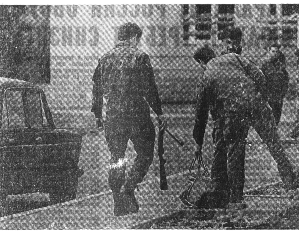
Александр ПАШКОВ, «Известия»

Руководство Свердловского областного отделения Союза ветеранов Афганистана отдало приказ своим членам захватить два жилых дома, сданных строителями под заселение. Я спросил сотрудника службы безопасности союза [есть у афганцев и такая] К. Альтмана, имеется ли у его людей оружие, и пояснил я ему, если потребуются, — ответил плевачеством.