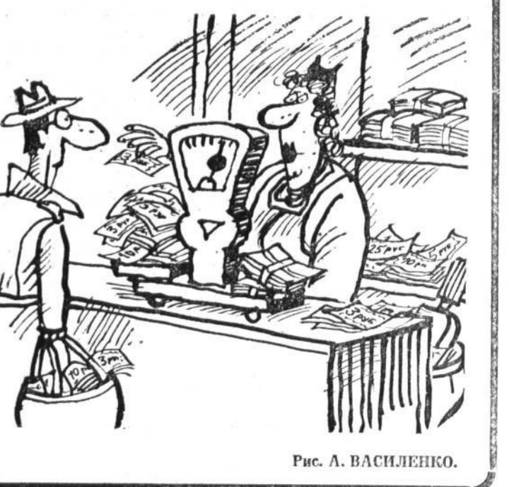
Рис. А. ВАСИЛЕНКО.