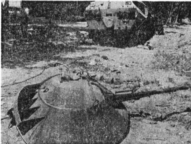
Следы боев у здания полиции.

Лишь полицейские патрули, разгуливающие по улицам, выдают бдительность, положенную при нынешних военных условиях. Жертвой этой бдительности я стал буквально в первый же час пребывания в городе — был задержан как распоследний шпион при съемке стратегического объекта — здания железнодорожного вокзала. Мои еди-