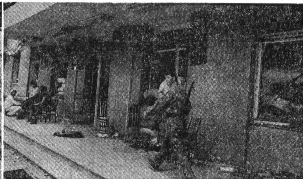
Так выглядит сегодня горсовет.