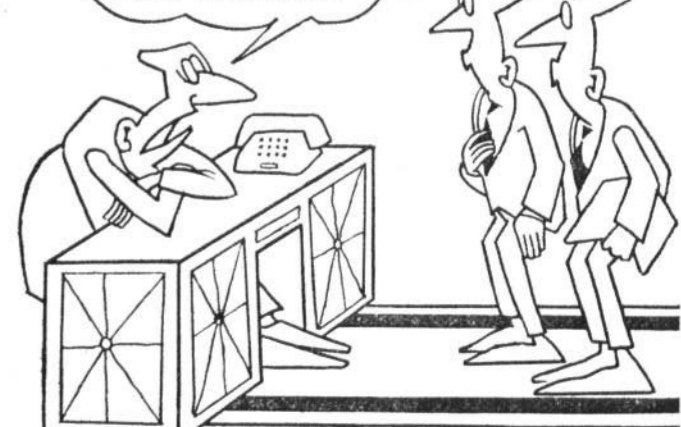
Рис. Ю. БОРЯКИНА.

«...и посадил мне — посадил мне — ПОСКОЛЬКУ МЫ ВОЗРОЖДЯЕМ СТАРЫЕ ТРАДИЦИИ, ЗОВИТЕ МЕНЯ БАРИНОМ!»