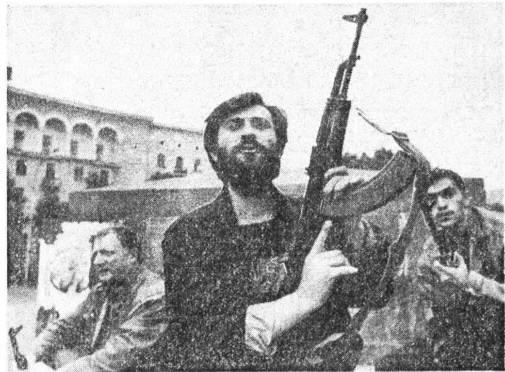
Национальные гвардейцы у здания телецентра Тбилиси.