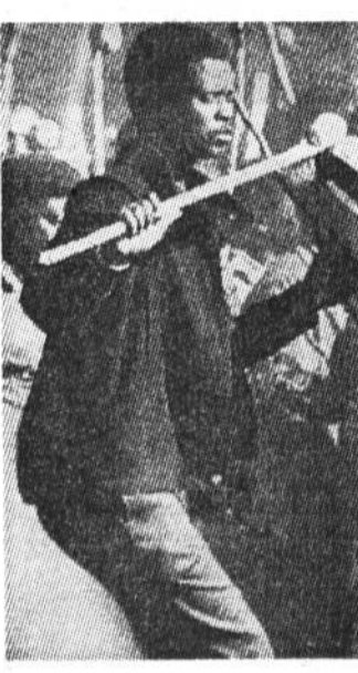
Представитель правительства наемников, который, как утверждают сторонники АНК, участвовал в резне в Бойлатонге.

Можно напомнить также о том, что АНК не впервые грозит прекратить переговоры. Так уже было в апреле прошлого года, когда от президента потребовали сменить двух министров — оборонный и законности и порядка.