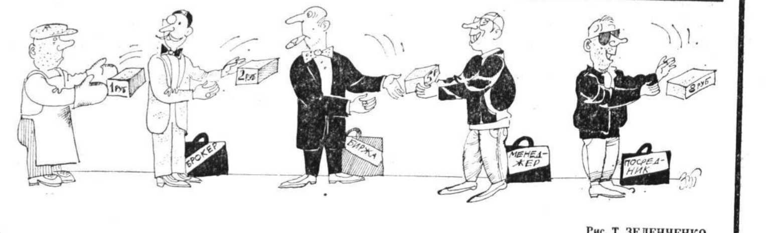
Рис. Т. ЗЕЛЕНЧЕНКО.