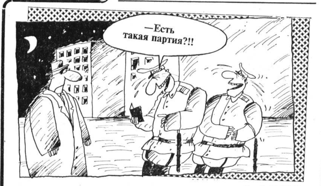
Рис. В. ШИЛОВА.

Английский взгляд на российские проблемы читайте в специальном приложении «THE REFORMING OF RUSSIA»