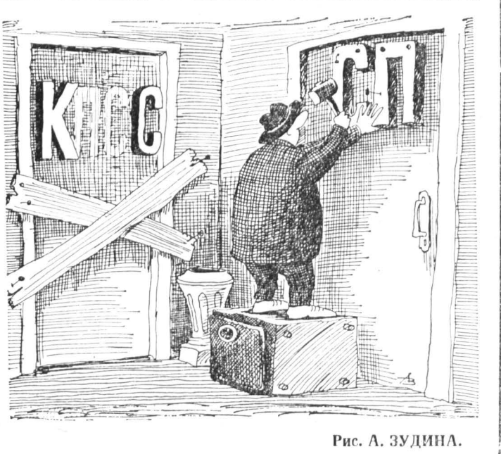
Рис. А. ЗУДИНА.