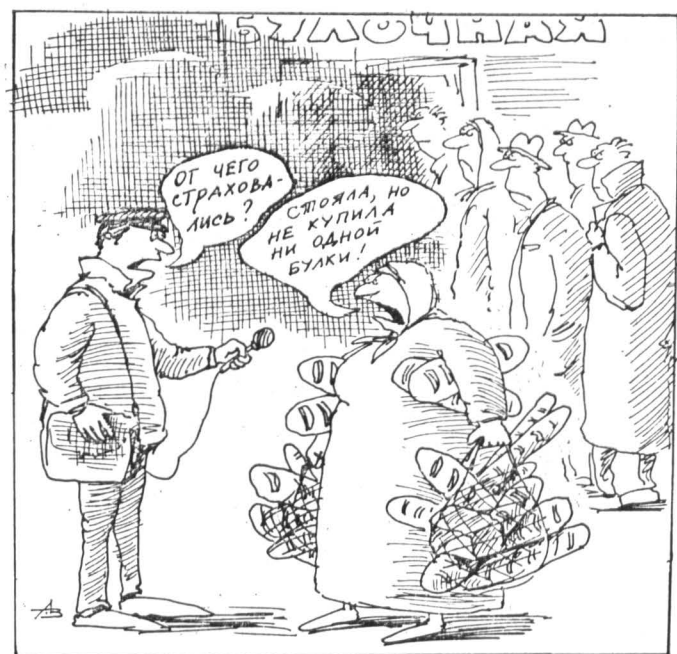
Рис. А. ЗУДИНА.