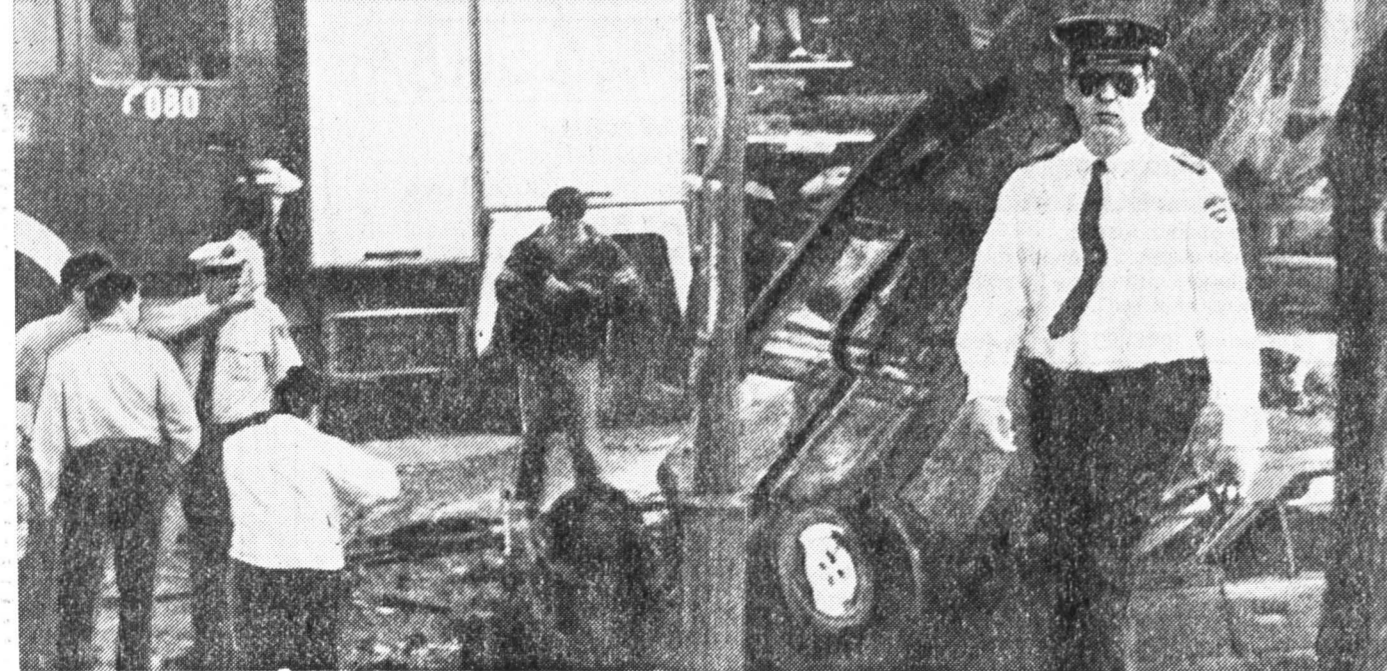
В Мадриде террористы из баскской националистической группировки ЭТА совершили очередное преступление. На чиненный динамитом автомобиль взорвался неподалеку от стадиона «Висенте Кальдерон», когда рядом с ним проезжал полицейский грузовик, прибывший для обеспечения порядка во время футбольного матча. Ранения получили шестеро полицейских и трое случайных прохожих. Террористический акт, счет которым уже потерян, «вписывается» в стратегию устранения, которую ЭТА намерена проводить в преддверии Олимпийских игр в Барселоне.

На снимке: на месте взрыва, Телерадио АН—ИТАР—ТАСС.