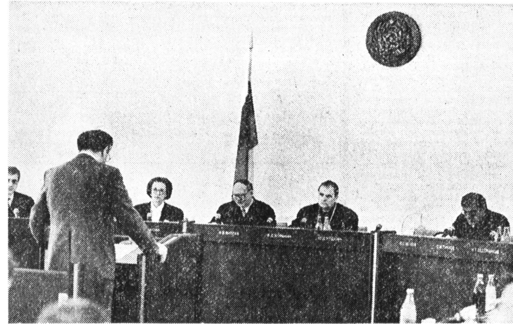
Валерий ВЫЖУТОВИЧ, «Известия»

Впреки ожиданиям 26 мая, в день открытия слушаний по делу КПСС, на Ильинке, где расположен Конституционный суд России, было относительно спокойно. Краснознаменные пикетчики, не считая двух-трех пожилых одиночек, не слишком досаждали миллицейским нарядам, выставленным на всякий случай.