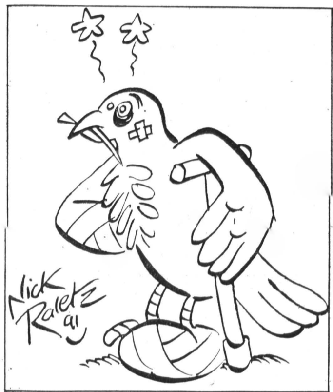
Голубь мира после пролета над СНГ. Рис. из газеты «Эспри либр» (Франция).

Мариан Чалфа передал Леониду Кравчуку письмо от президента ЧФР Вацлава Гавела, в котором высказано его стремление к развитию всесторонних отношений, а также приглашение посетить Чехословакию. Оно было с благодарностью принято. ИТАР — ТАСС.