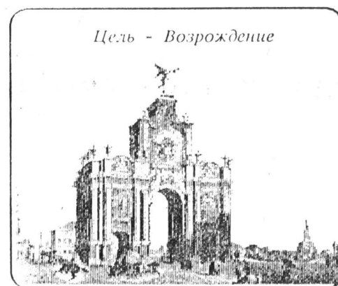
Цель - Возрождение