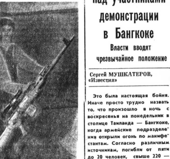
Это была настоящая бойня. Иначе просто трудно назвать то, что произошло в ночь с воскресенья на понедельник в столице Таиланда — Бангкоке, когда армейские подразделения вновь открыли огонь по манифестантам. Согласно различным источникам, погибли от пяти до 20 человек, свыше 220 — ранены.