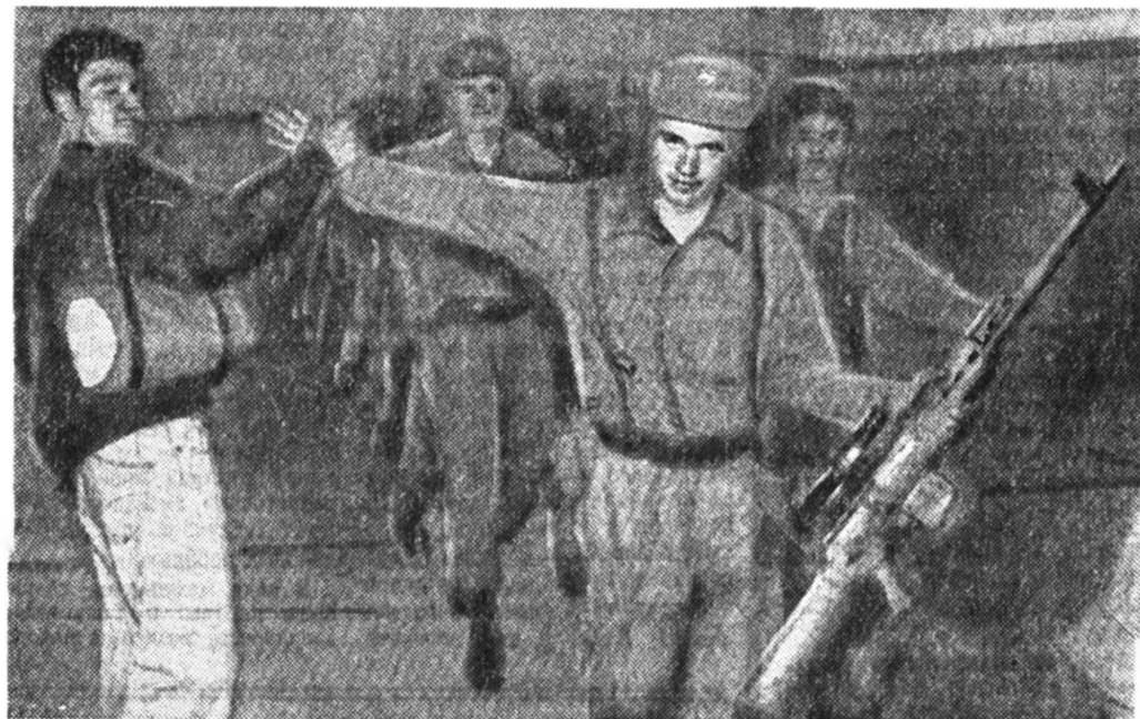
Югославская федеральная армия начала вывод своего контингента из Боснии и Герцеговины. На снимке из Газеты «Интернешнл Белграда».