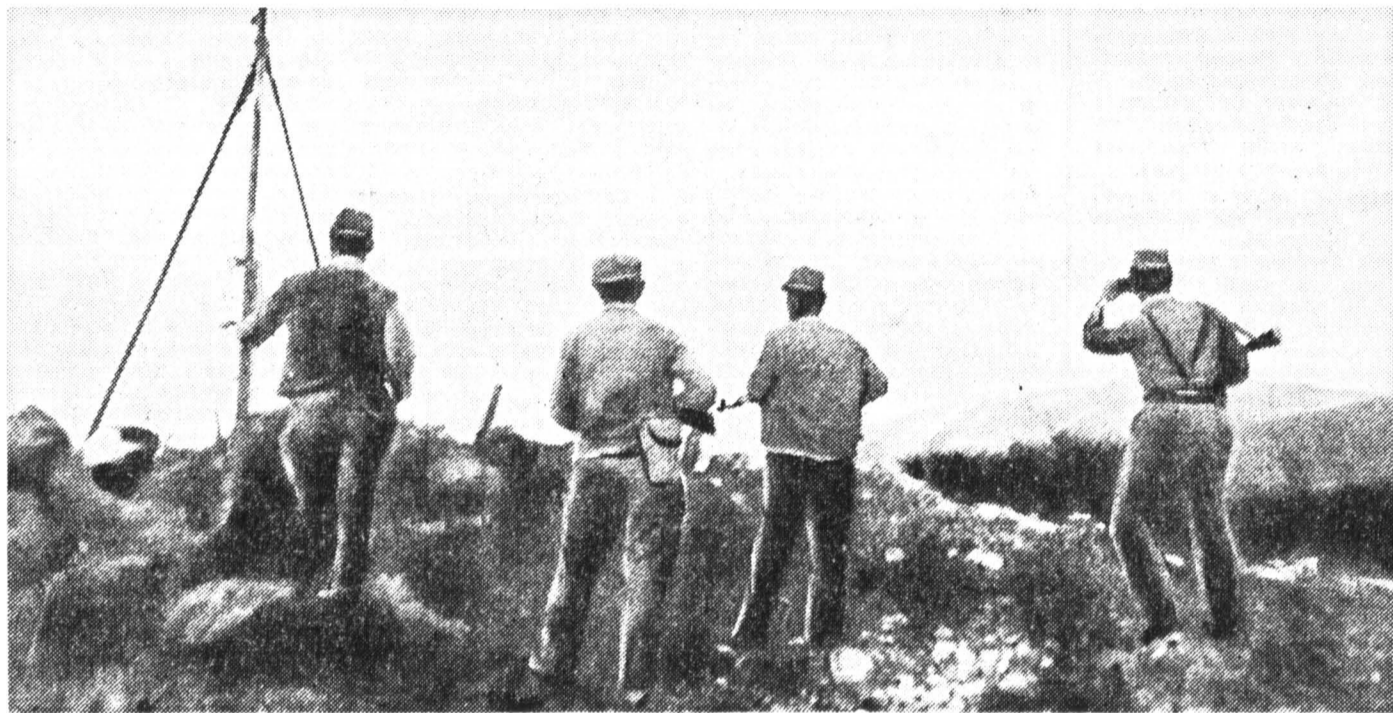
Резко обострилась обстановка на армяно-азербайджанской границе. От обстрела на всех видов оружия, включая артиллерию, пострадали приграничные армянские села Таушского, Горисского и Иджеванского районов Армении. На снимке: ополченцы сил самообороны Таушского района охраняют границу Армении с Азербайджаном.

По оценкам экспертов, даже при самом благоприятном стечении обстоятельств референдум удастся провести не раньше осени этого года. Помимо объектив-