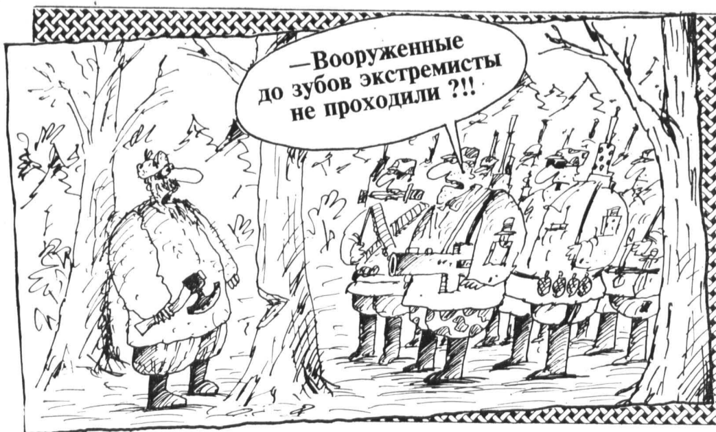
Рис. В. ШИЛОВА.

Как сообщалось ранее, читателям, оформившим подписку до 1 января 1992 года, газета будет доставляться до конца года по старой цене — 29 рублей 04 копейки за весь год. Индекс «Известий» — 50050, «Неделя» — 50162.