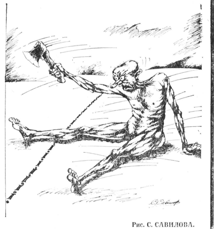
Рис. С. САВИДОВА.

СЛАДКАЯ ЖИЗНЬ МЕТАЛЛУРГОВ МАГНИТКИ Немного крупнее и 50-килограммовый мешок сахара уносят теперь домой в день зарплат металлурги Магнитки. Слабое предприятие сократило таким образом дефицит наличности больше чем на 150 млн. рублей. ИТАР—ТАСС.