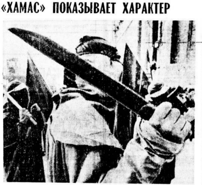
«ХАМАС» ПОКАЗЫВАЕТ ХАРАКТЕР