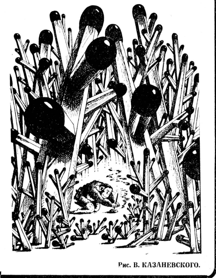
Рис. В. КАЗАНЕВСКОГО.