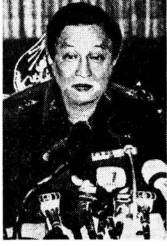
С. Крапраон — 19-й по счету премьер с 1932 года, когда Таиланд стал конституционной монархией, и 8-й, получивший власть прямо из рук военных.

Открытие первой сессии нового парламента, избранного 22 марта в Таиланде, ждали с особым нетерпением. Она должна была ответить на главный вопрос: насколько серьезны намерения военных, совершивших год назад государственный переворот, отдать власть гражданскому правительству.