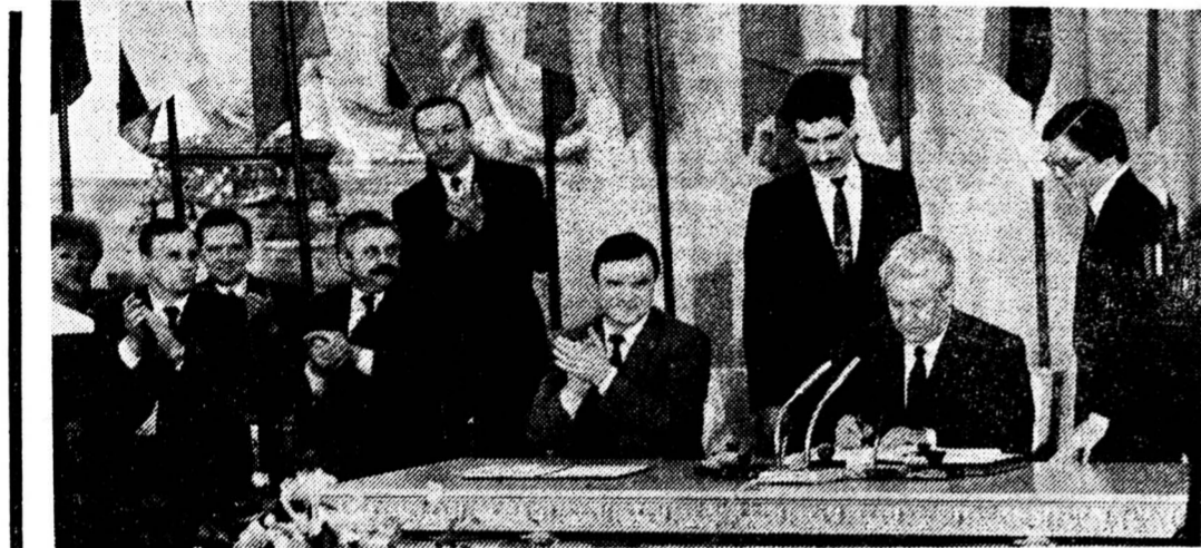
Николай АНДРЕЕВ, «Известия»

Подписание 31 марта Федеративного договора было обставлено весьма и весьма торжественно: Москва, Кремль, Георгиевский зал Большого Кремлевского дворца. Полномочные делегации республик, автономных образований, краев, областей, Москвы, Санкт-Петербурга. Перед подписанием договора спокойное напутствие президента Б. Ельцина. Он высказал убеждение: «Единая Россия была, есть и будет, ход отечественной истории не прервется».