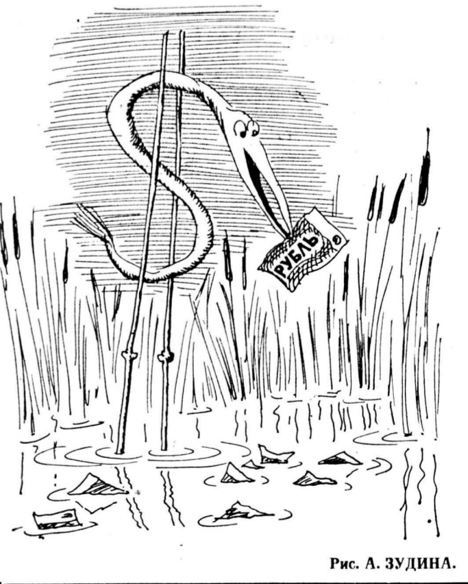
Рис. А. ЗУДИНА.