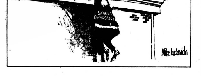
Президент США Дж. Буш, обращаясь к российским демократам: «Знайте, сердцем я с вами...»