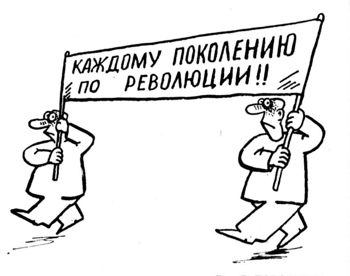
Рис. В. ТАРАСЕНКО.