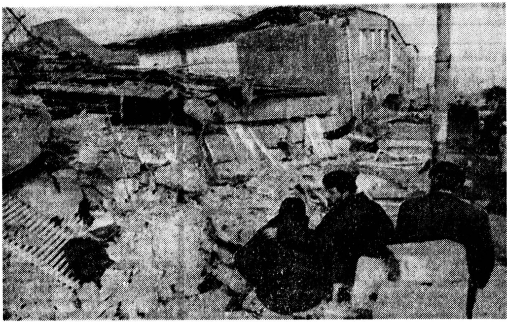
Максим ГАН, «Известия»

По сообщением агентства Ассошиэтед Пресс, в воскресенье в восточной части Турции были опять зарегистрированы подземные толчки силой 6 баллов по шкале Рихтера. Однако информация о новых жертвах нет, хотя спасатели и были вынуждены прервать свои работы.